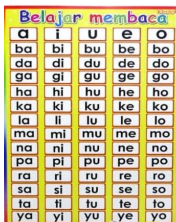
Gambar IV. IV (CDF4)

mengenalkan bacaan satu kata, seperti “ ibu, saya, ayah ” dengan cara ibu C menyebutkan huruf satu persatu dan anak menuliskannya di buku, dan kegiatan berhitung ibu C menggunakan peralatan yang ada di kelas, seperti spidol, balok, kotak pensil anak.