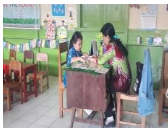
Anak Sedang Membaca