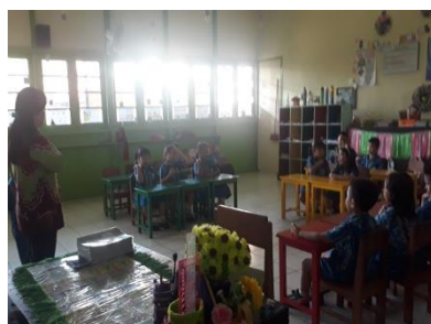
Gambar IV. II (CDF2)

Guru berdiskusi dan melakukan Tanya jawab kepada anak tentang apa saja yang mereka lakukan sebelum pergi ke sekolah, setelah itu guru menjelaskan sebuah lembaran kertas yang berisi tentang pekerjaan.