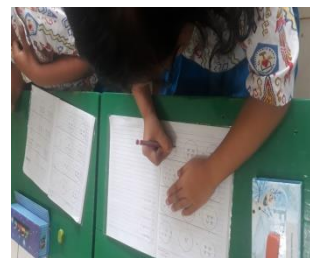
Anak berhitung sambil Menulis