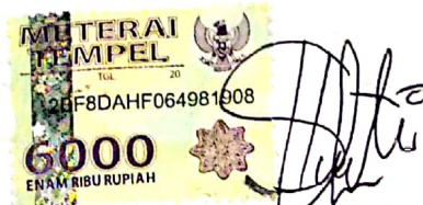
Santi Dila Yanti