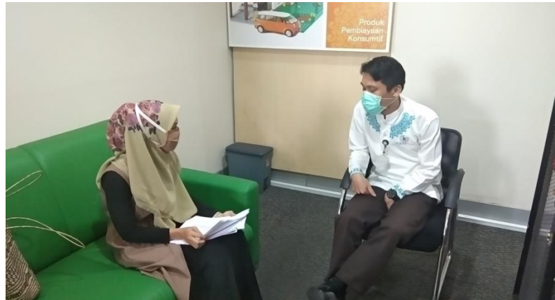
Wawancara Mengenai Strategi Penyaluran Pembiayaan Produk Mikro 3 iB