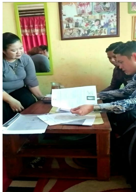
Menganalisa Keaslian Berkas Jaminan Nasabah Untuk Pembiayaan Mikro