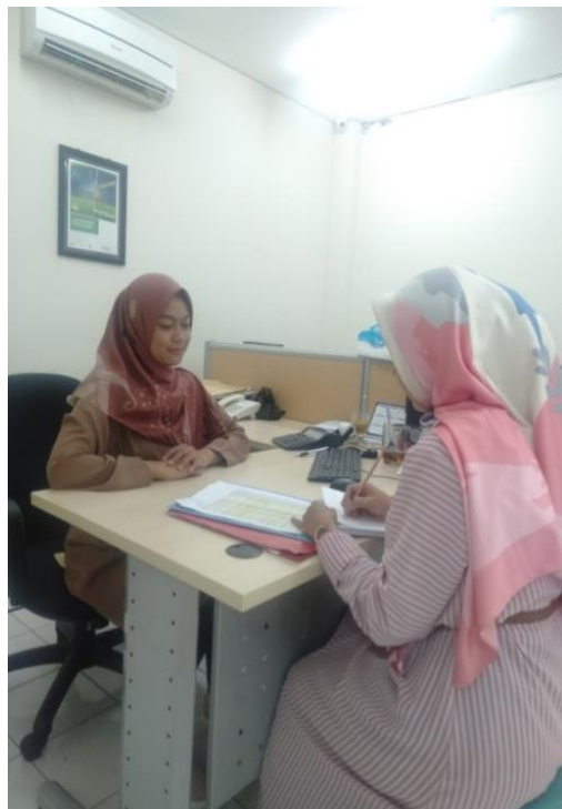
Saat melakukan wawancara dengan Unit Umum