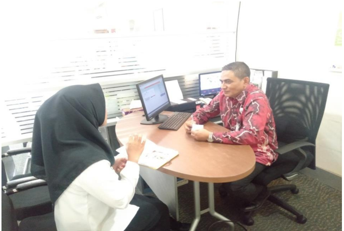
Saat melakukan wawancara dengan Operational Manager (OM)