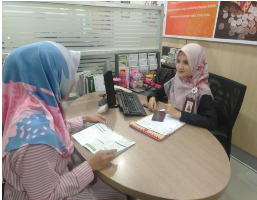
Saat melakukan wawancara dengan Funding Assistant