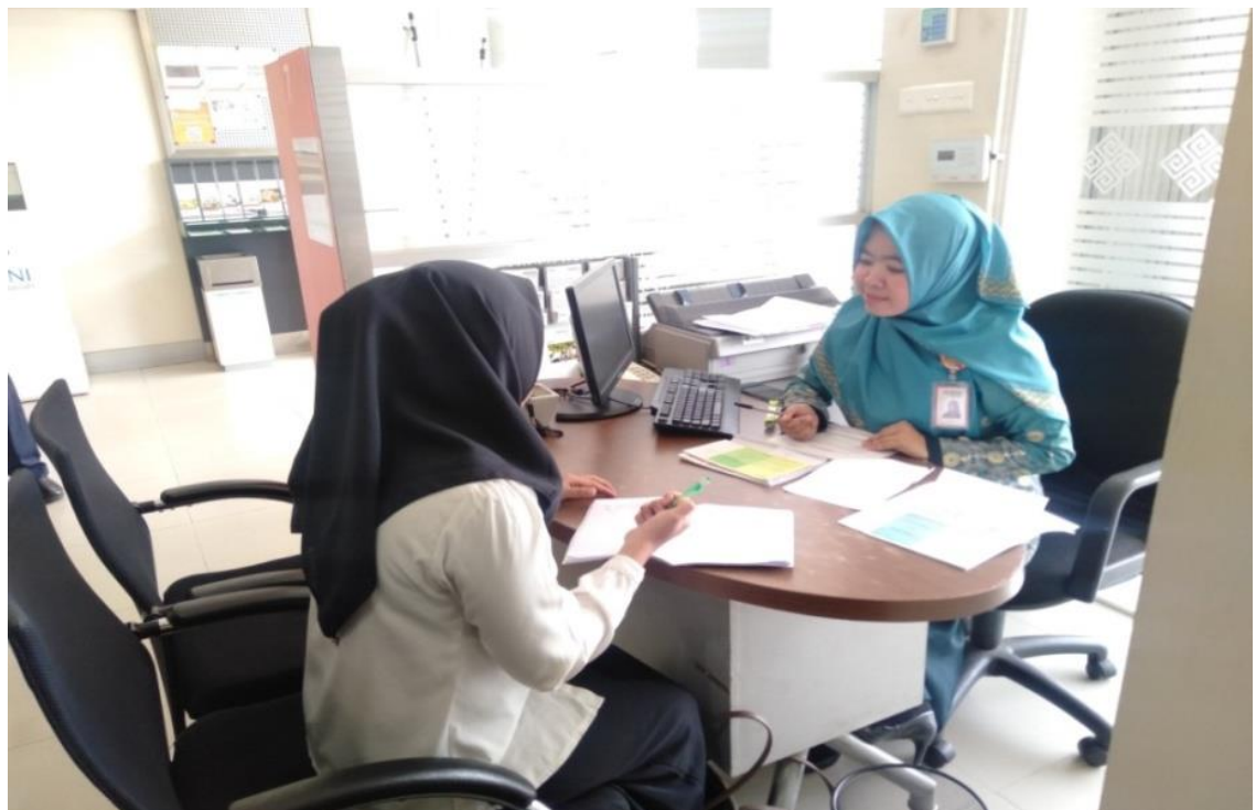
Saat melakukan wawancara dengan Customer Service (Head)