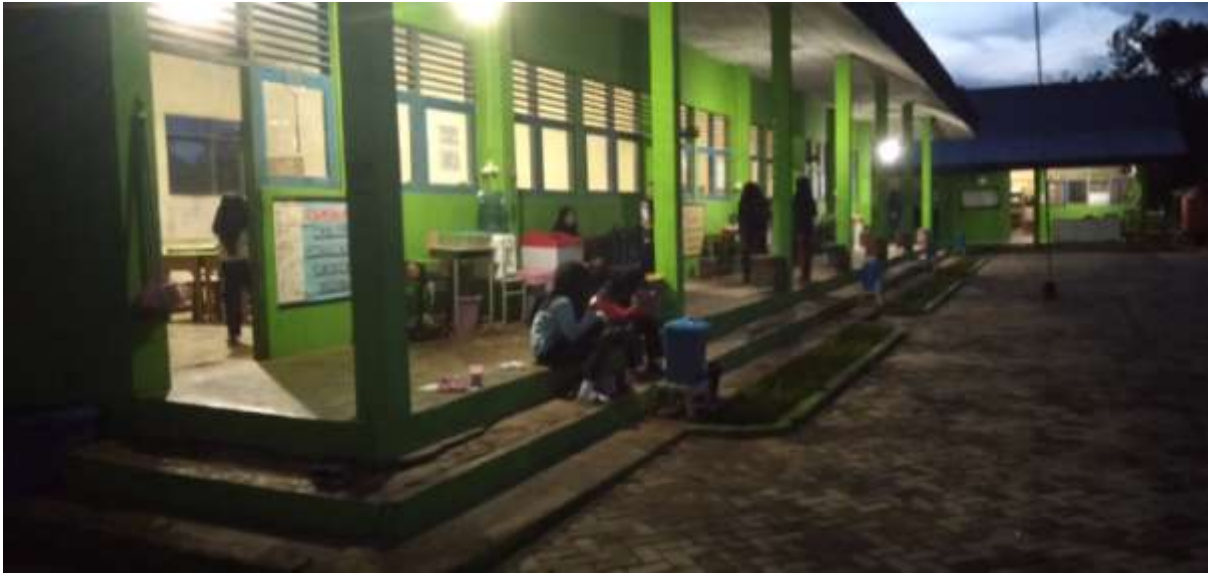
Senam pagi sabtu bersama