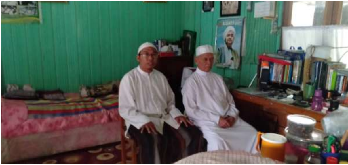
Wawancara dengan pimpinan yayasan dan pengasuh panti asuhan Budi Akhlakuk Karimah