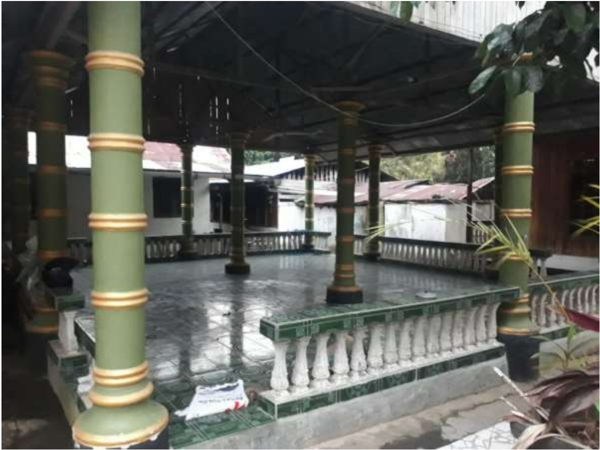
Halaman samping mesji