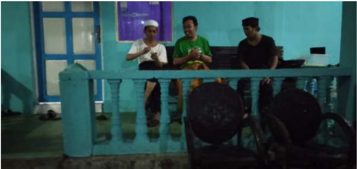
Wawancara dengan pimpinan dan pengasuh panti asuhan Siti Khadijah