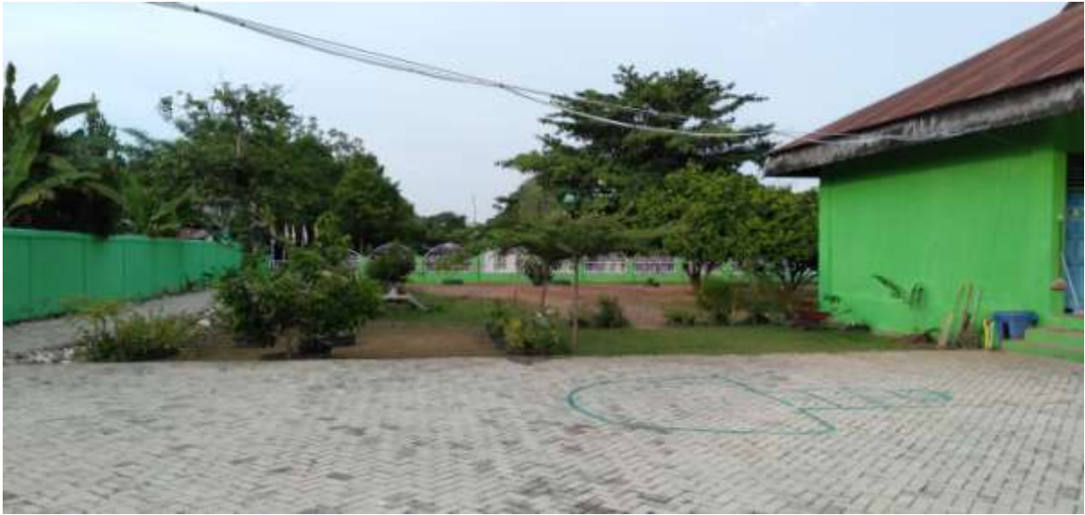
Lingkungan sekitar dalam panti asuhan