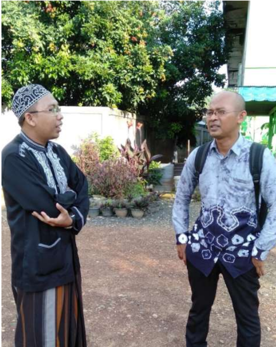
Wawancara dengan ketua dan pengasuh panti asuhan Miftahussalam