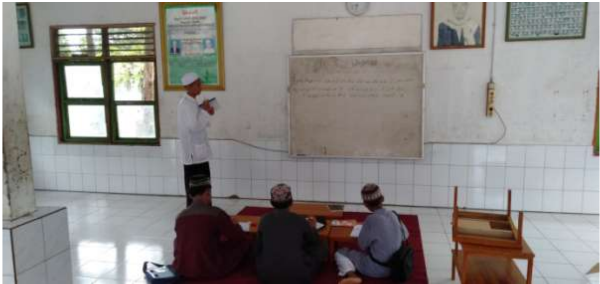
Kegiatan pesantren sore