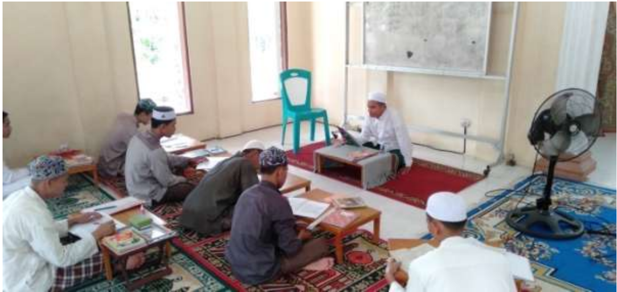
Kegiatan pesantren pagi