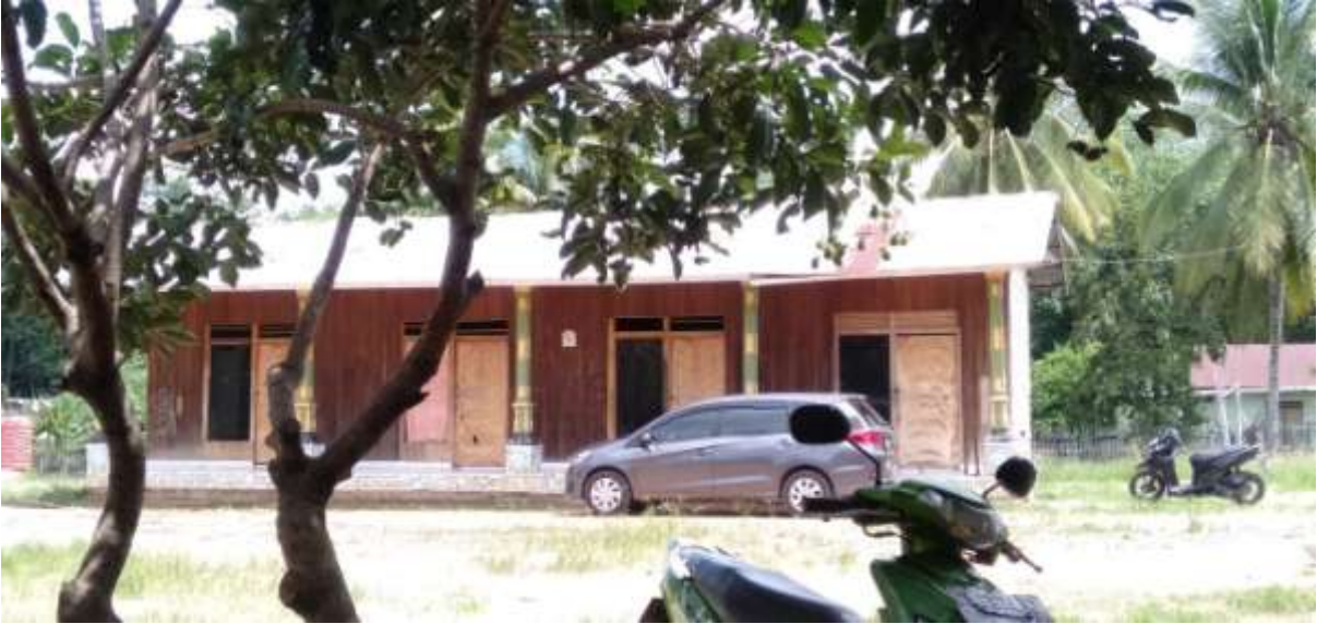
Tempat mandi putera