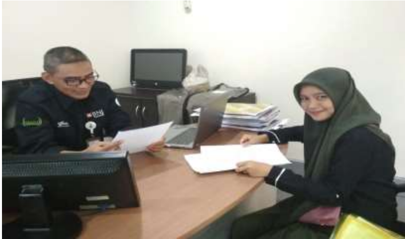
Foto saat wawancara dengan SME Junior AO PT.BNI Syariah Kantor Cabang Banjarmasin