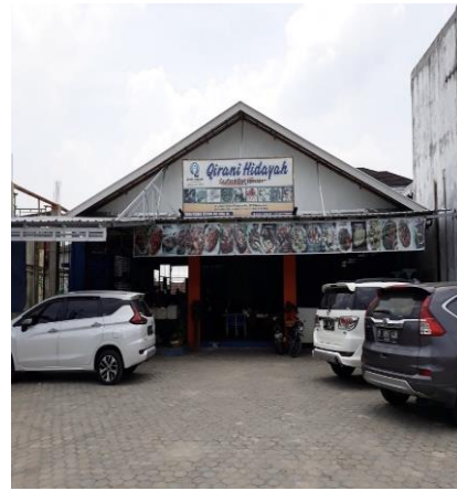
2. RM. Qirani Hidayah (Tampak depan)