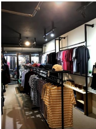
3. Malestore Banjarmasin (Tampak dalam)