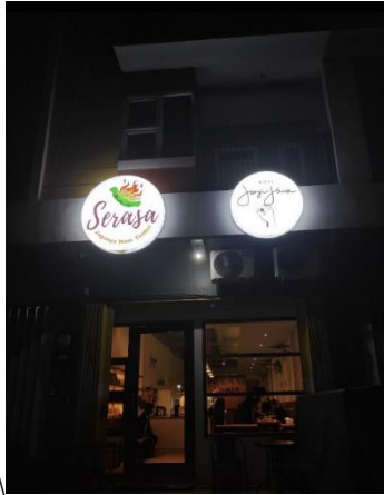
1. Kopi Janji Jiwa edisi 51 (Tampak depan)