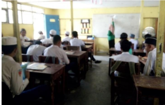
Gambar II. Penyampaian Materi

Tahap selanjutnya, guru membagi siswa menjadi 8 kelompok. Lalu guru membagikan LKS kepada setiap kelompok. LKS berisi soal tentang sifat-sifat kubus dan balok. Sebelum siswa menjawab LKS, guru memberi arahan terlebih dahulu. Dalam mengerjakan LKS, ada siswa yang berdiskusi sambil berdiri. Ada juga siswa yang membiarkan teman kelompoknya mengerjakan dan dia tidak ikut berdiskusi. Guru selalu memberi teguran jika ada siswa yang tidak ikut berdiskusi. Setelah siswa selesai mengerjakan LKS, setiap kelompok mempresentasikan hasil diskusi tersebut.