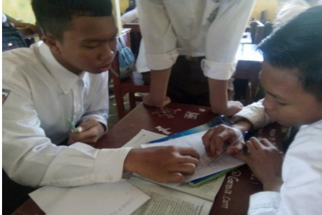
Gambar VII. Diskusi Membahas LKS

Setelah siswa selesai mengerjakan LKS, setiap kelompok mempresentasikan hasil diskusi tersebut.