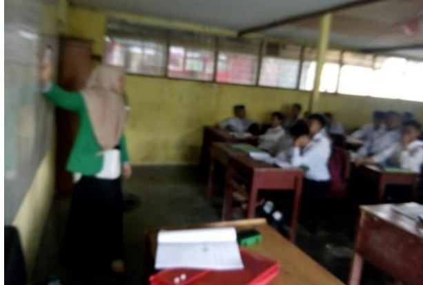
Gambar IV. Penyampaian Materi

guru kembali menjelaskan bagaimana menentukan luas permukaan kubus dan dilanjutkan bagaimana menentukan volume kubus.