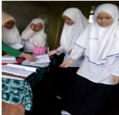
Gambar XVII. Tugas Individu

Guru meminta siswa mengerjakan soal untuk memantapkan pemahaman siswa terhadap materi yang dipelajari. Seperti pada pertemuan sebelumnya, soal dikerjakan secara individu. Siswa boleh mengerjakan soal dengan membuka buku catatan.