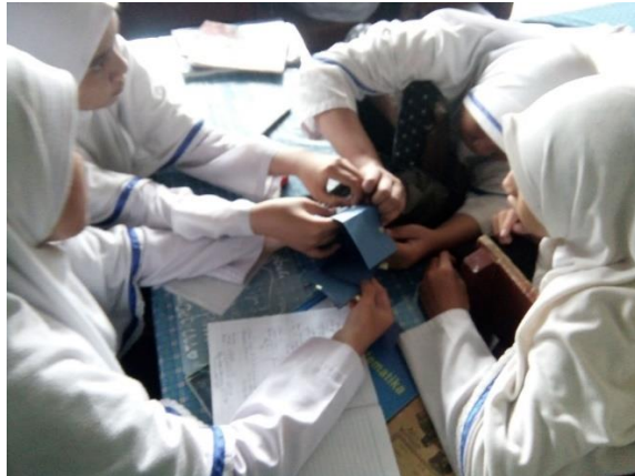
Gambar XV. Diskusi Membahas LKS

tersebut. Guru mendekati setiap kelompok untuk membantu atau memberi penjelasan agar siswa tidak merasa kesulitan dalam mengerjakan.