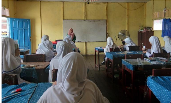
Gambar IX. Aktivitas Berlangsungnya Pretest di Kelas Eksperimen