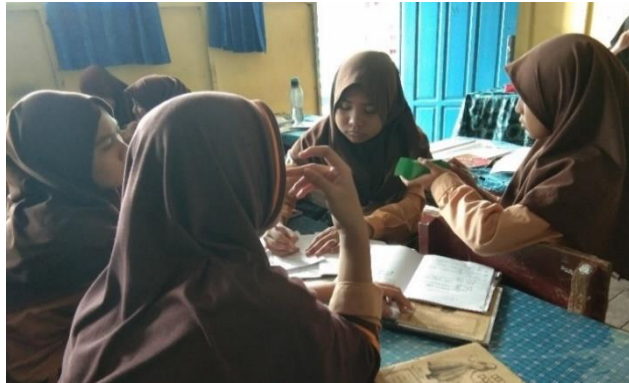
Gambar XIX. Diskusi Membahas LKS

Tahap selanjutnya siswa secara berkelompok berdiskusi. Guru membagi siswa menjadi 8 kelompok. Kemudian guru membagikan LKS dan media untuk didiskusikan. Media yang digunakan adalah balok yang terbuat dari karton. Guru memberikan arahan sebelum siswa berdiskusi. Siswa akan mencari tahu bagaimana mendapatkan rumus luas permukaan balok, menentukan luas, dan volume balok tersebut.. Setiap diskusi di kelas eksperimen, siswa selalu bekerjasama dalam menyelesaikan LKS. Mereka selalu bertanya kepada guru jika kebingungan.