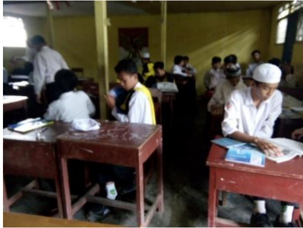
Gambar V. Diskusi Membahas LKS