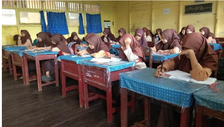
Gambar XIII. Tugas Individu