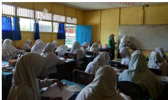
Gambar XVI. Presentasi Kelompok

Setiap kelompok bergantian menuliskan hasil diskusinya di papan tulis dan mempresentasikan hasil diskusi kelompoknya. Setelah siswa selesai presentasi, guru memberi penegasan terhadap jawaban siswa.