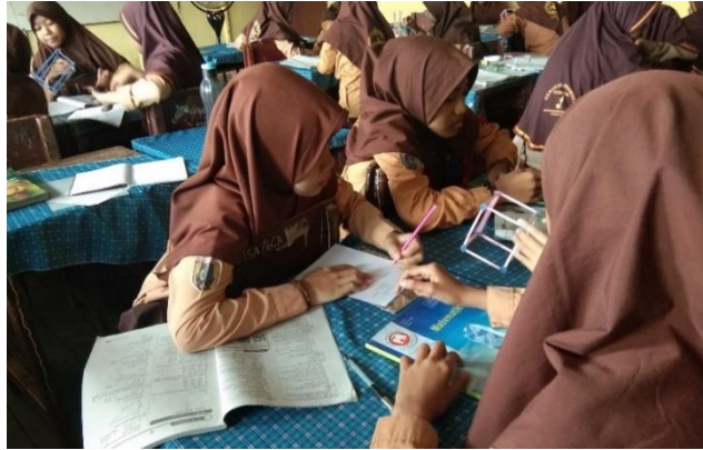
Gambar XI. Diskusi Membahas LKS