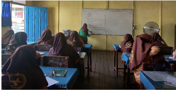
Gambar XX. Aktivitas Berlangsungnya Posttest di Kelas Eksperimen

Selanjutnya guru menuliskan soal di papan tulis. Siswa dipersilahkan mengerjakan soal. Posttest dikerjakan secara individu.