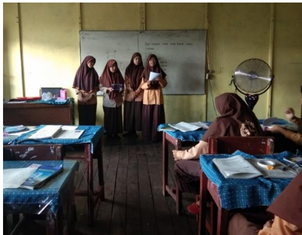
Gambar XII. Presentasi Kelompok

Guru meminta siswa untuk mempresentasikan hasil diskusi kelompoknya. Setiap kelompok mendapat kesempatan untuk mempresentasikan ke depan kelas. Setiap siswa selesai presentasi, guru memberi penegasan terhadap jawaban siswa.