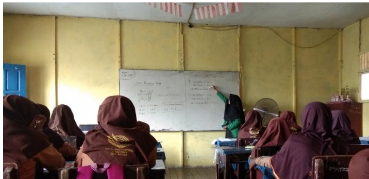
Gambar XVIII. Penyampaian Materi

Pertemuan kelima guru menyajikan materi tentang luas permukaan balok dan volume balok. Guru menjelaskan tentang luas permukaan balok terlebih dahulu dengan membahas bagaimana mendapatkan rumus luas permukaan balok tersebut. Setelah siswa memahami bagaimana cara menentukan rumus tersebut lalu guru kembali menjelaskan bagaimana menentukan luas permukaan balok dan dilanjutkan bagaimana menentukan volume balok. Guru meminta siswa untuk bertanya jika ada yang tidak dipahami. Siswa hanya bertanya mengenai satuan pada perhitungan luas permukaan balok dan volume balok.