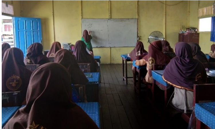
Gambar X. Penyampaian Materi