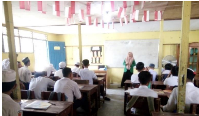
Gambar VI. Penyampaian Materi

Pertemuan kelima guru menyajikan materi tentang luas permukaan balok dan volume balok. Guru menjelaskan tentang luas permukaan balok terlebih dahulu dengan membahas bagaimana mendapatkan rumus luas permukaan balok tersebut. Kemudian guru meminta siswa untuk bertanya jika ada yang tidak dipahami. Siswa tidak ada yang bertanya tetapi meminta pengulangan beberapa kali dari penjelasan guru. Setelah siswa memahami bagaimana cara menentukan rumus tersebut lalu guru kembali menjelaskan bagaimana menentukan luas permukaan balok dan dilanjutkan bagaimana menentukan volume balok.