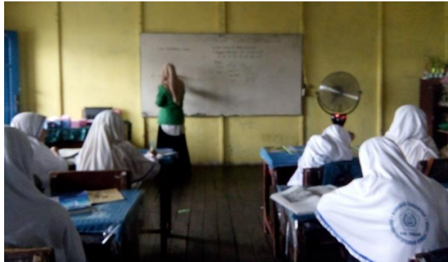
Gambar XIV. Penyampaian Materi

Pada pertemuan ketiga guru menyajikan materi tentang luas permukaan kubus dan volume kubus. Guru menjelaskan tentang luas permukaan kubus terlebih dahulu dengan membahas bagaimana mendapatkan rumus luas permukaan kubus tersebut.. Setelah siswa memahami bagaimana cara menentukan rumus tersebut, guru kembali menjelaskan bagaimana menentukan luas permukaan kubus dan dilanjutkan bagaimana menentukan volume kubus.