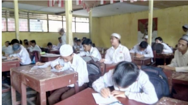
Gambar I. Aktivitas Berlangsungnya Uji Pretest di Kelas Kontrol