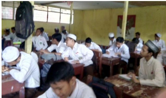
Gambar VIII. Aktivitas Berlangsungnya Posttest di Kelas Kontrol

Tahap ini siswa mengerjakan posttest yang bertujuan untuk mengetahui kemampuan akhir siswa terhadap materi yang telah mereka pelajari. Posttest dikerjakan selama 70 menit dengan jumlah siswa sebanyak 31 orang. Sebelum dilaksanakannya posttest , guru mengingatkan siswa untuk menyimpan buku matematikanya. Lalu guru mengajak siswa untuk mempersiapkan kertas dan pulpen. Selanjutnya guru menuliskan soal di papan tulis. Siswa dipersilahkan mengerjakan soal. Posttest dikerjakan secara individu.