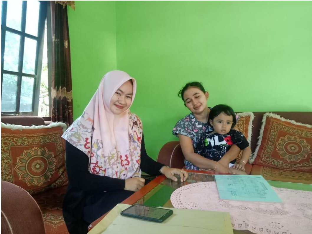
Wawancara dengan ibu NS, pada tanggal 5 Juli 2020