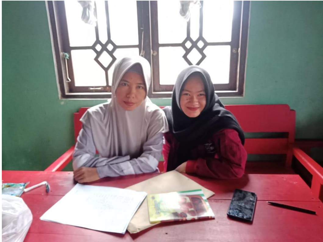
Wawancara dengan ibu UK pada tanggal 9 Juli 2020