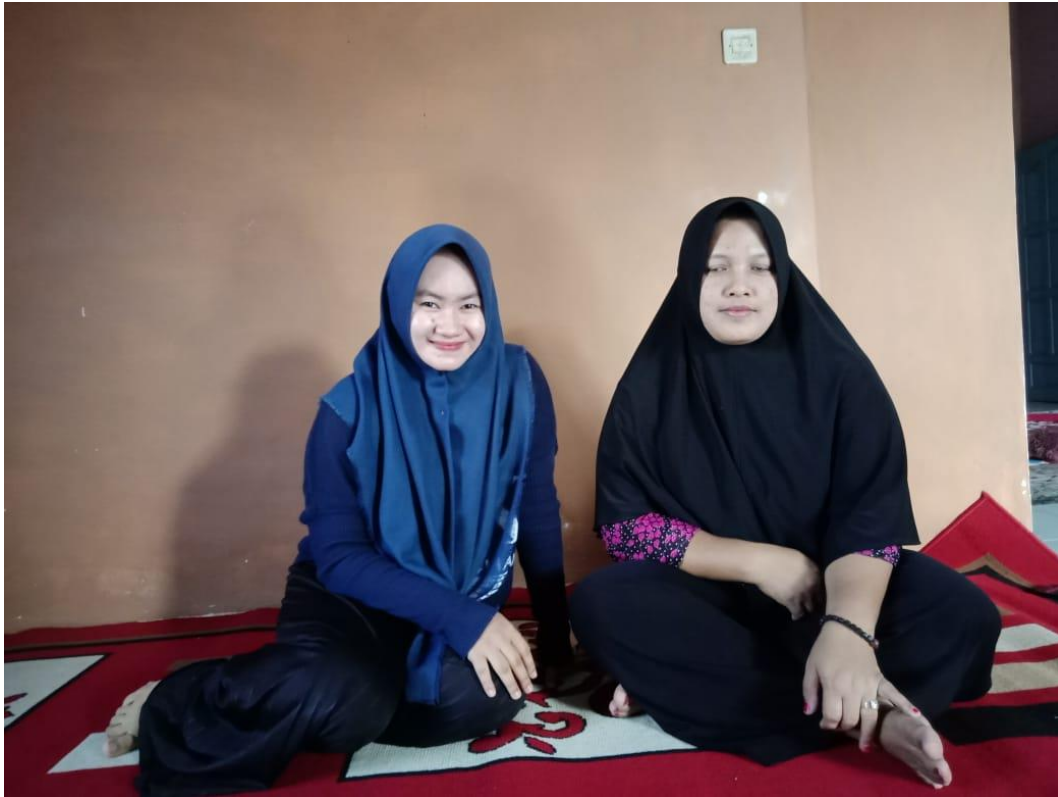
Wawancara dengan ibu SL pada tanggal 3 Juli 2020.