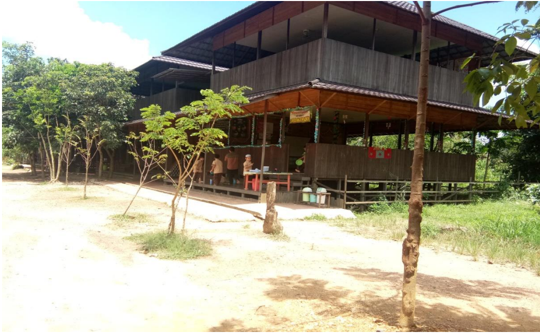
Gambar kelas 1 SDIT Alfirdaus Banjarmasin