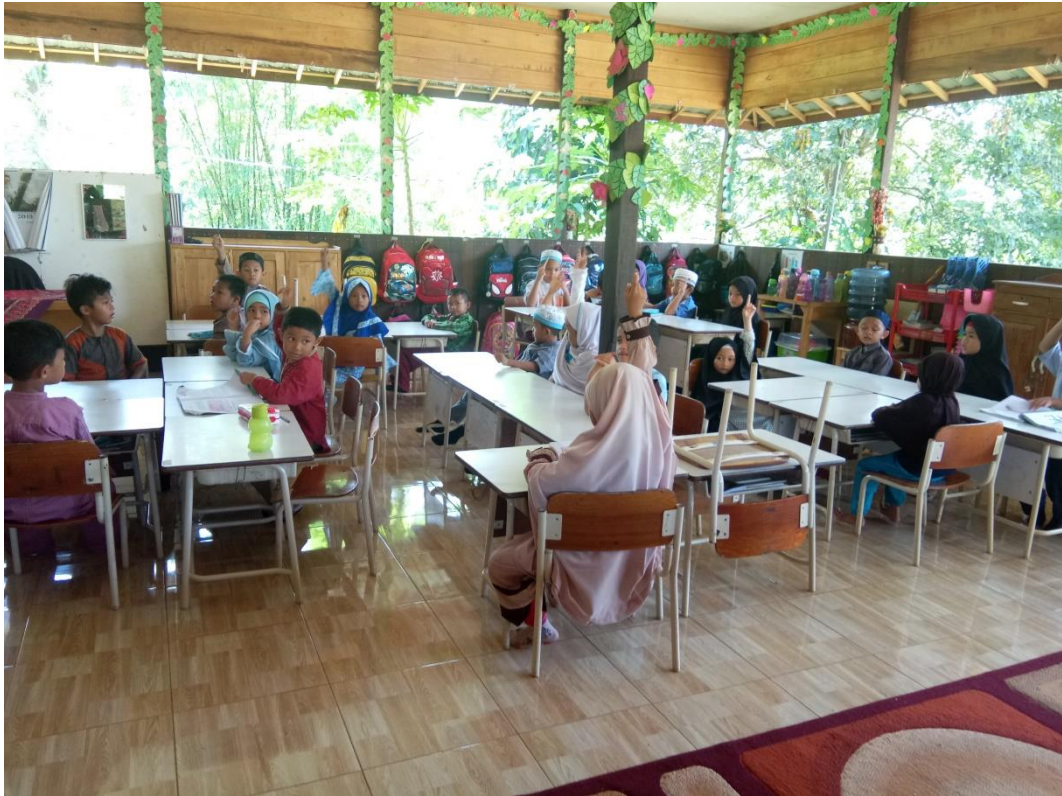
Suasana pembelajaran dalam kelas 1 SDIT Al-Firdaus Banjarmasin