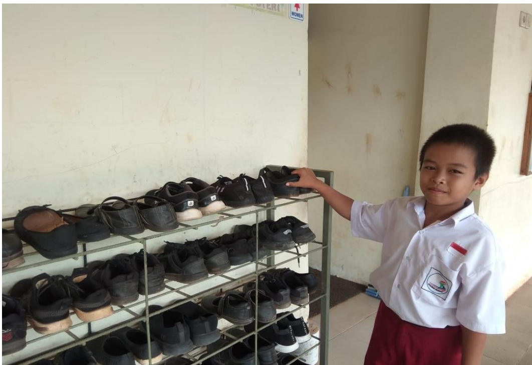
Menyusun rapi sepatu pada tempat nya salah satu penanaman nilai-nilai karakter