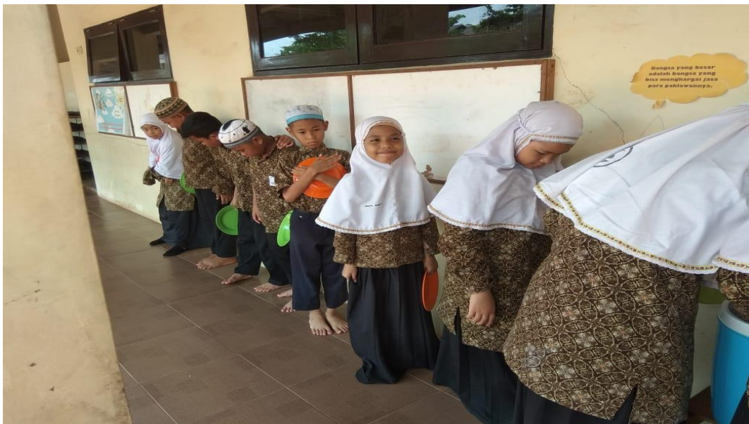
Penanaman nilai-nilai karakter mengantri dengan rapi sebelum makan siang di SDIT Al-Firdaus Banjarmasin