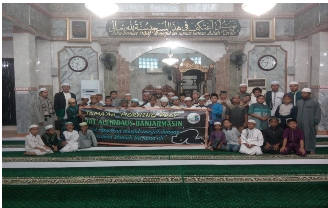
Shalat subuh berjamaah para murid SDIT Al-Firdaus Banjarmasin