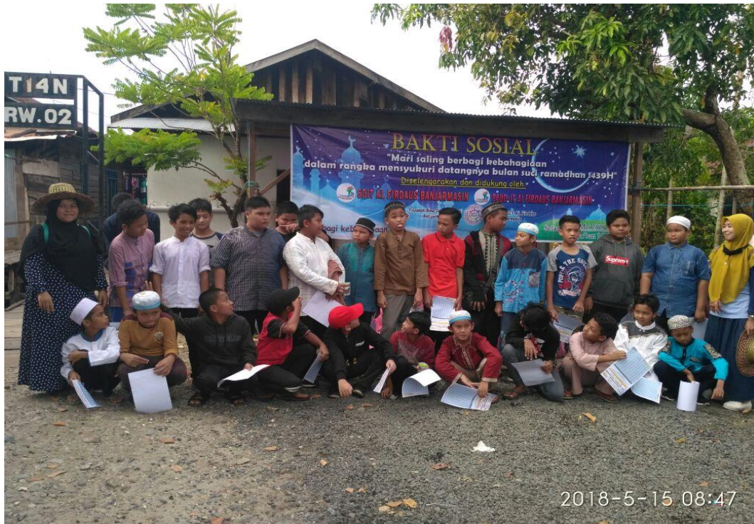
Bakti sosial SDIT Al-Firdaus Banjarmasin kepada masyarakat sekitar