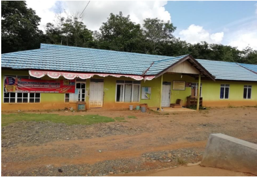
Kantor Guru MTs Darul Huda