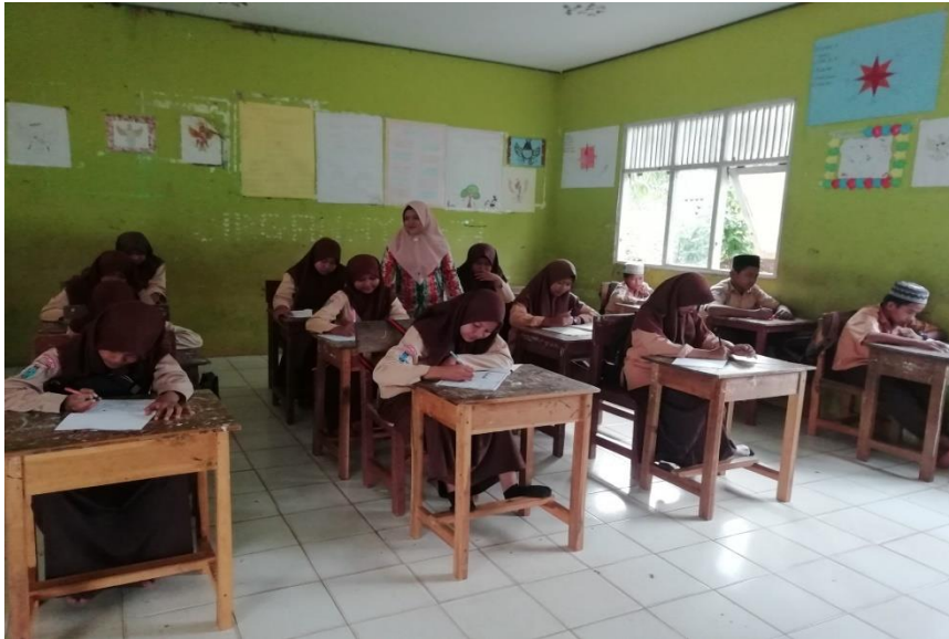
Kegiatan belajar di kelas