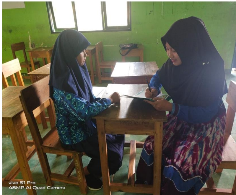
Wawancara dengan Siswa Kelas IX