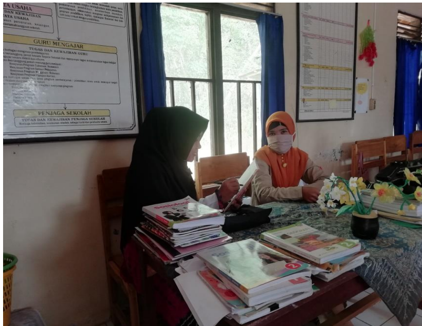
Wawancara dengan Guru BK (Bimbingan Konseling)