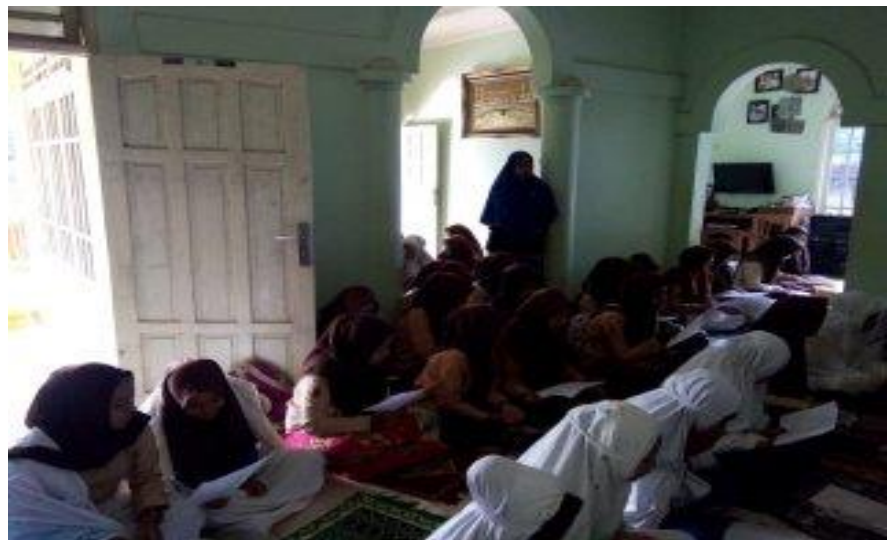
Kegiatan tadarus al-Qur'an berjamaah