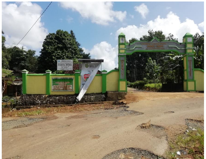
Gerbang MTs Darul Huda