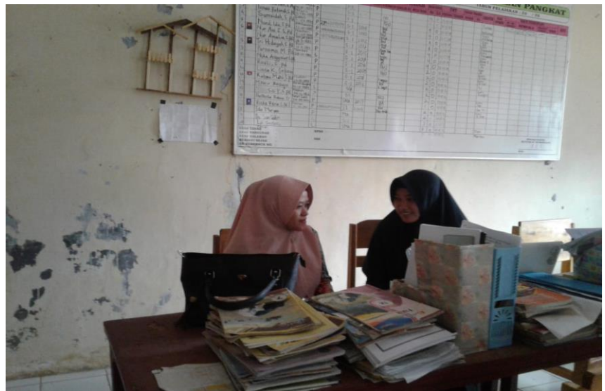
Wawancara dengan Guru Aqidah Akhlak