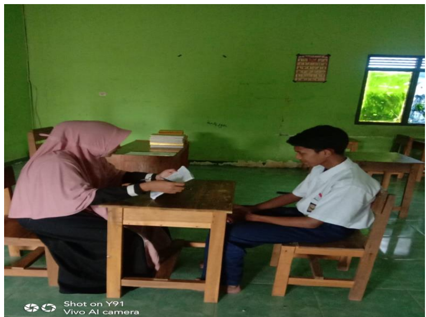
Wawancara dengan Siswa Kelas VII