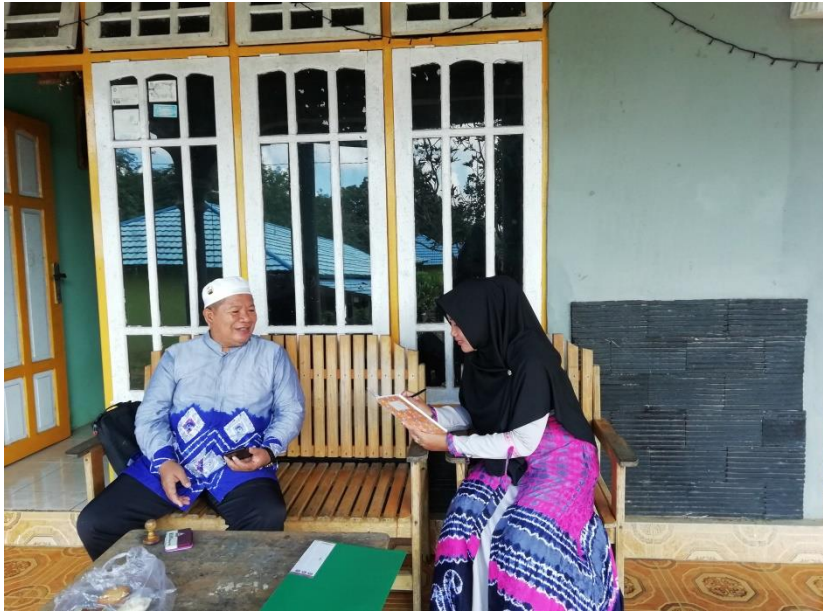
Wawancara dengan Kepala Sekolah