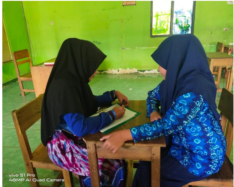
Wawancara dengan Siswa Kelas VIII