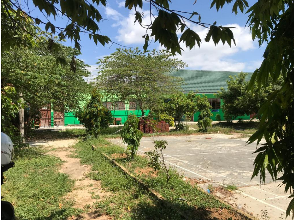
ساحة المدرسة المتوسطة الإسلامية بالمعهد الإسلامي هداية الله تامن هدايا مرتابورا