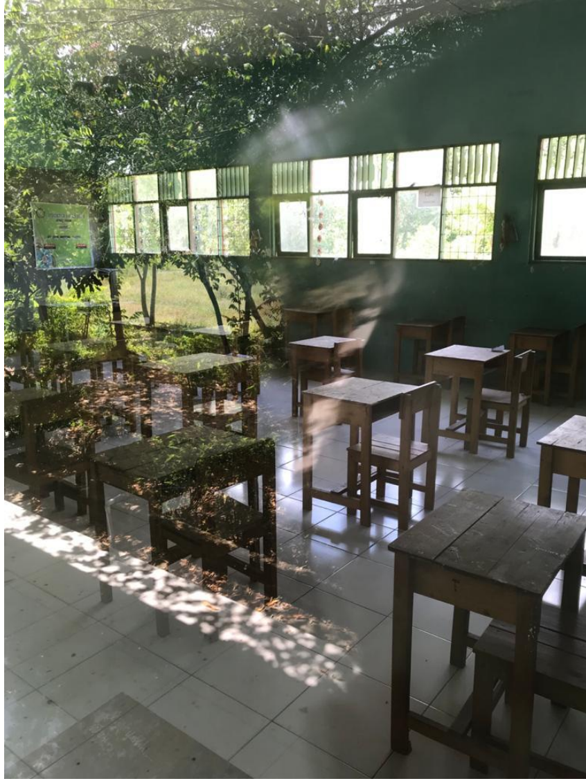
الصف المدرسة المتوسطة الإسلامية بالمعهد الإسلامي هداية الله تامل هدايا مرتابورا