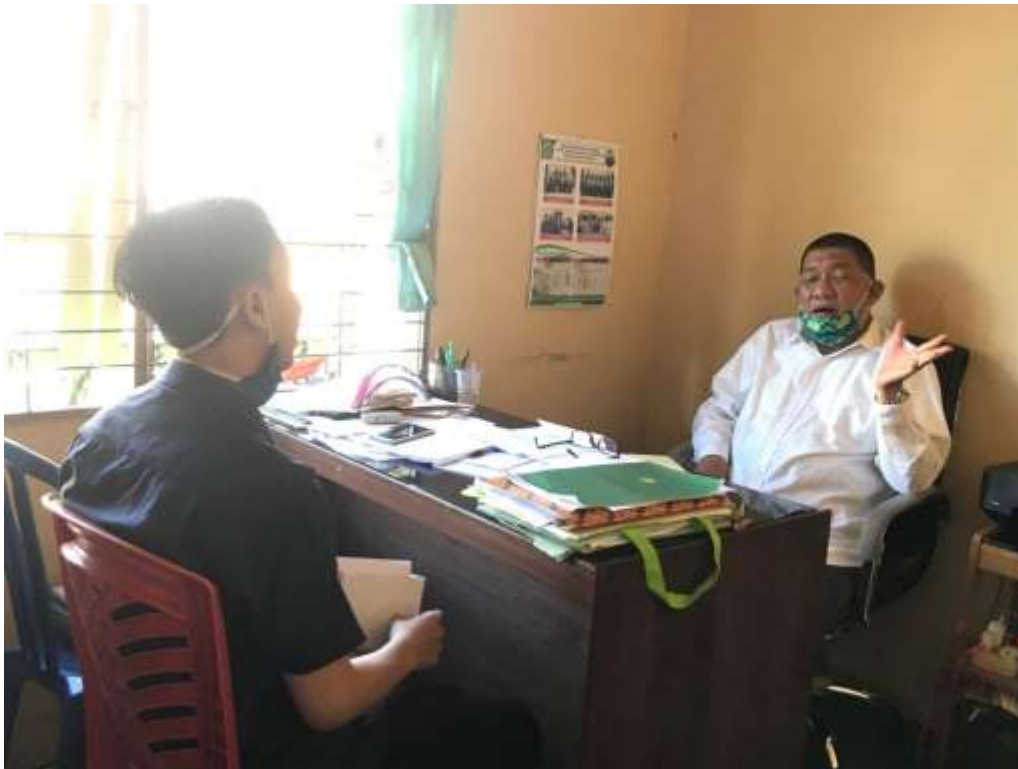
Dokumentasi wawancara dengan responden KUA Banjarmasin Tengah