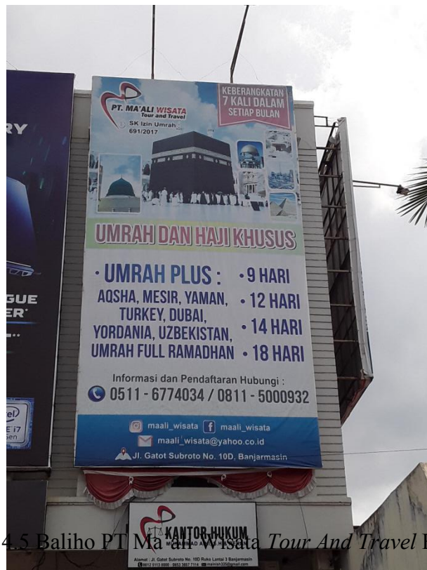
Gambar 4.5 Baliho PT Ma'ali Wisata Tour And Travel Banjarmasin