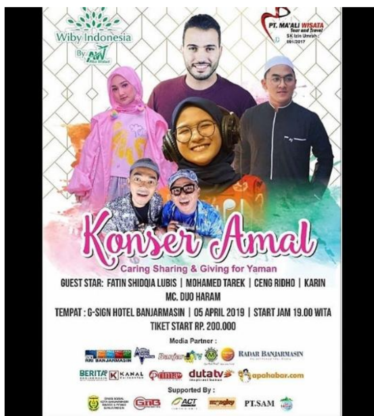
Gambar 4.7 Brosur Konser Amal PT Ma'ali Wisata Tour And Travel Banjarmasin.

Pernah menjadi sponsor Kemenag Banjarmasin tahun 2019 berhadiah Umrah, pameran (hadiah mengumrahkan) pertunjukan lomba-lomba, singa laut di taman Kamboja Banjarmasin, toko kosmetik acil bungas martapura umrah, pasar wadai siring wali kota Banjarmasin (Umrah), Jalan santai Milenial 2019 Banjarbaru (umrah) dan konser amal. 12