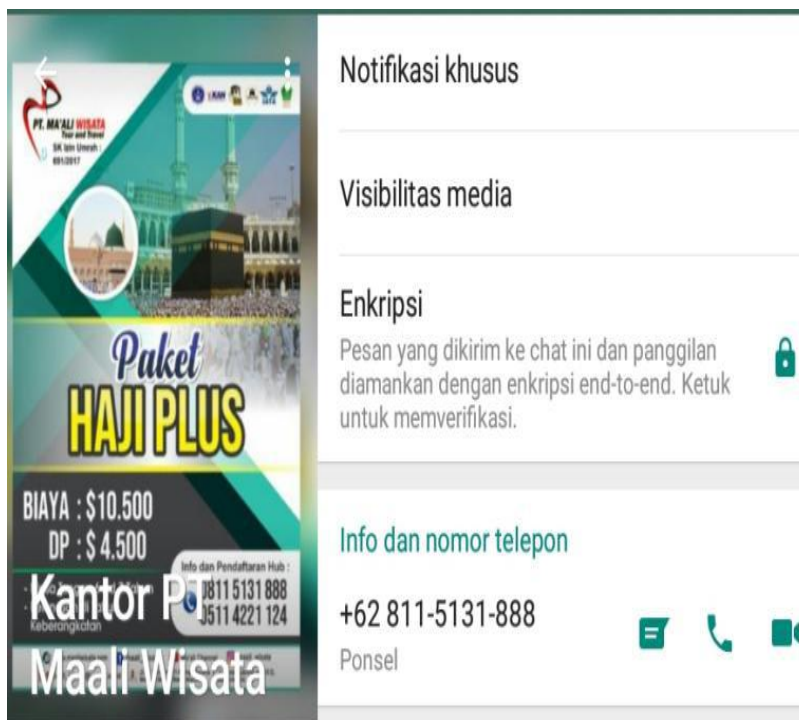
Gambar 4.4 whatsapp PT Ma'ali Wisata Tour And Travel Banjarmasin

Akun-akun media sosial tersebut langsung dikelola oleh staf bagian Marketing yang ada dikantor PT Ma'ali Wisata Tour And Travel Banjarmasin.