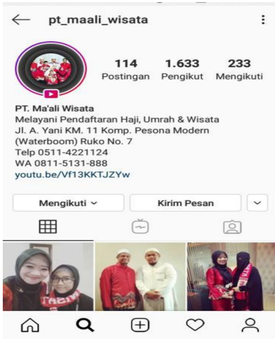
Gambar. 4.3 Instagram PT Ma'ali Wisata Tour And Travel Banjarmasin