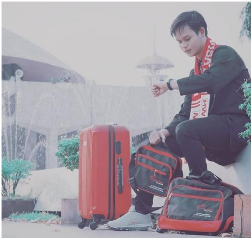
Gambar 4.8 bentuk koper tas tenteng dan tas paspor PT Ma'ali Wisata Tour And Travel Banjarmasin