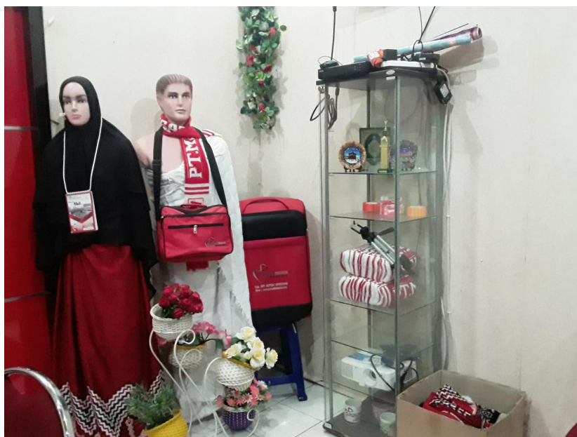
Gambar 4.9 Perlengkapan umrah lainnya untuk laki-laki dan perempuan PT Ma'ali Wisata Tour And Travel .

Analisis bukti fisik dalam strategi bauran pemasaran yang diterapkan oleh PT Ma'ali Wisata Tour And Travel , bukti fisik yang diterapkan oleh PT Ma'ali Wisata Tour And Travel mungkin tidak terlalu banyak dalam menarik minat calon jemaah karena mungkin tidak membedakan dengan travel yang lain, akan tetapi hanya warna untuk ciri khas saja yang membedakan dengan travel lain.