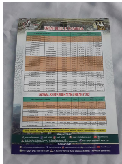
Gambar 4.6 Brosur PT Ma'ali Wisata Tour And Travel Banjarmasin