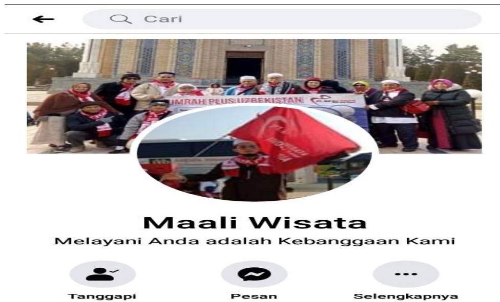
Gambar 4.2 Facebook PT Ma'ali Wisata Tour And Travel