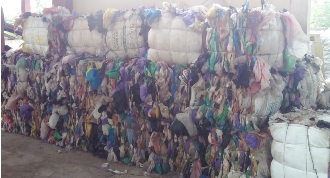
Pemilahan sampah pelastik