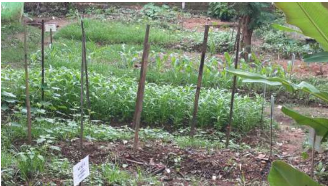
(Taman Hijau dan Kebun Sekolah SDN Antasan Besar 1 Kota Banjarmasin)