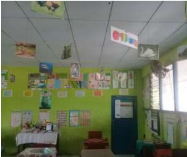
(Ruang Kelas SDN Antasan Besar 1)