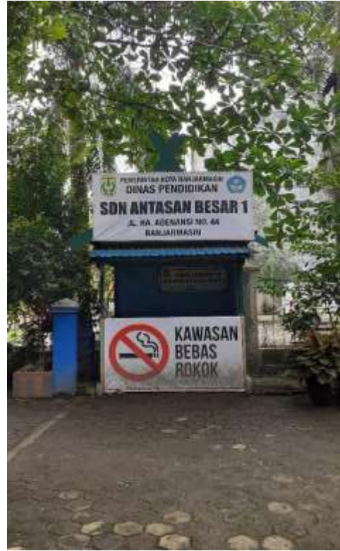
(Halaman SDN Antasan Besar 1 Kota Banjarmasin)