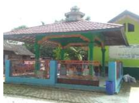
Kubah Habib Hasan bin Husein bin Hamid bin Abbas Bahasyim