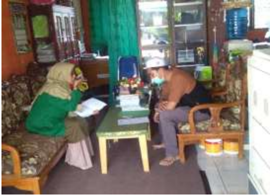
Wawancara dengan Bapak Kepala Sekolah