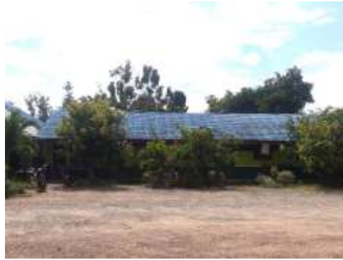
Ruang Kelas MI Darul Aman Kecamatan Bati-Bati