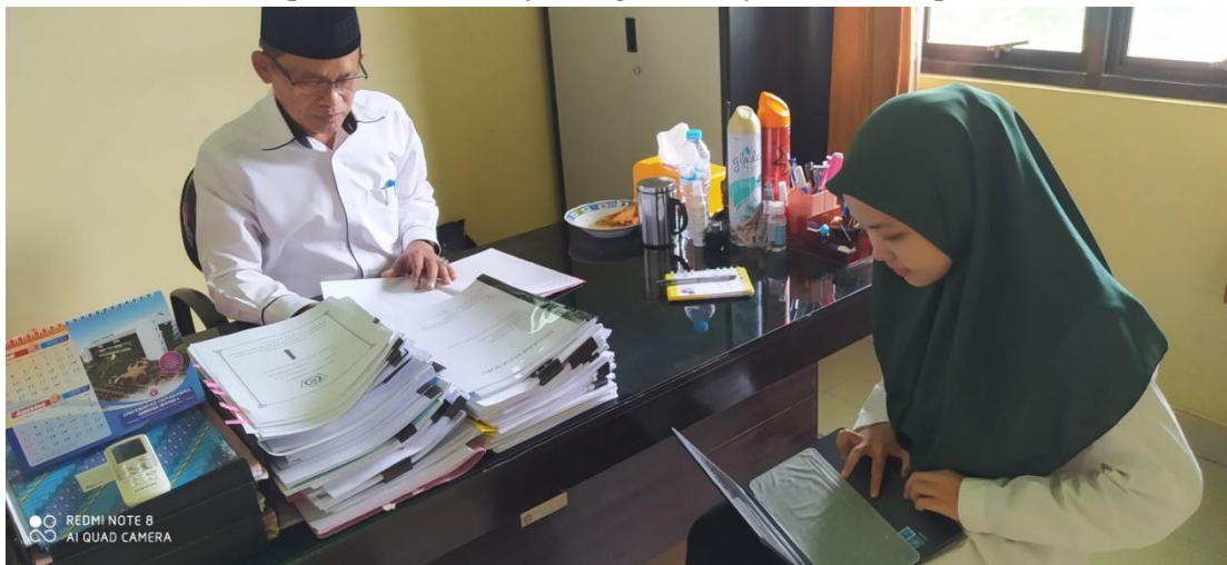
Foto Wawancara Bersama Kepala Madrasah Aliyah Negeri 4 Banjar