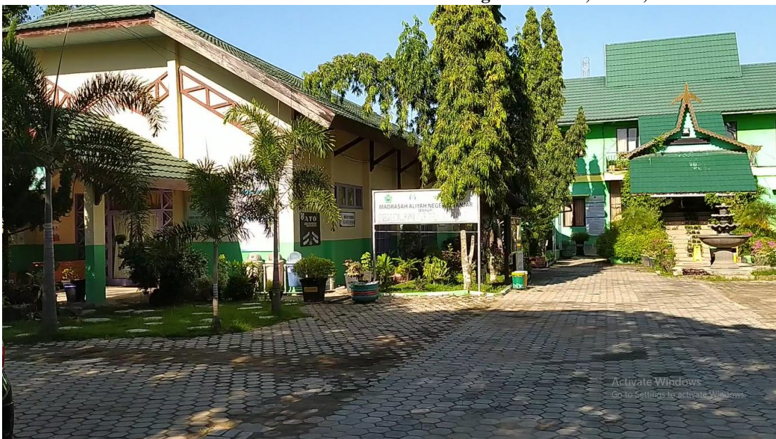
Foto Halaman Depan Madrasah Aliyah Negeri 4 Banjar