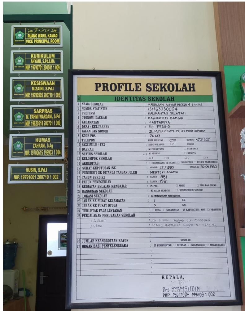
Foto Profile Sekolah