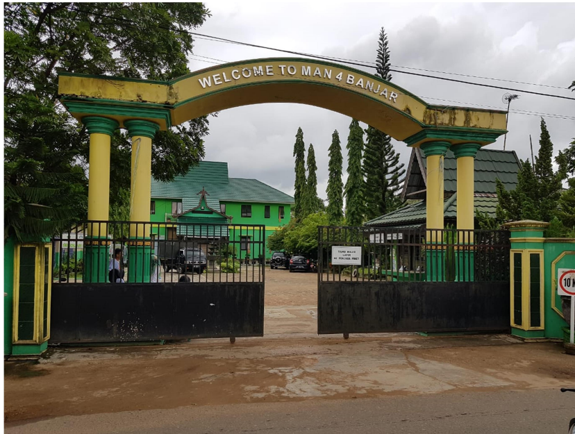
Foto di Depan Lingkungan MAN 4 Banjar