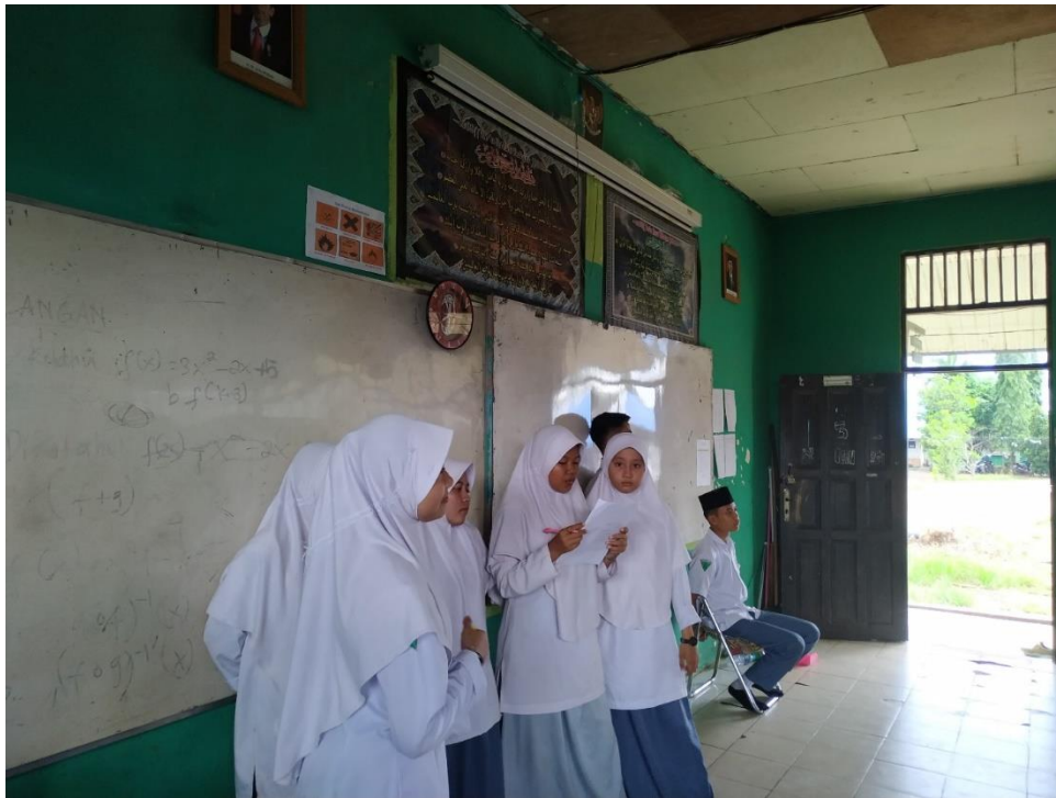
(wawancara dengan siswa-siswi MAN Tanah Laut)