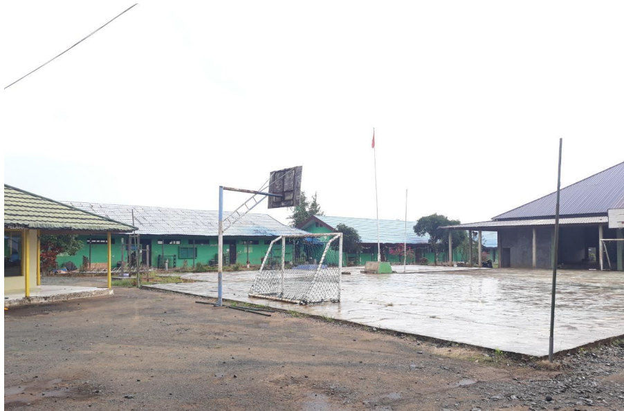
(lapangan MAN Tanah Laut)