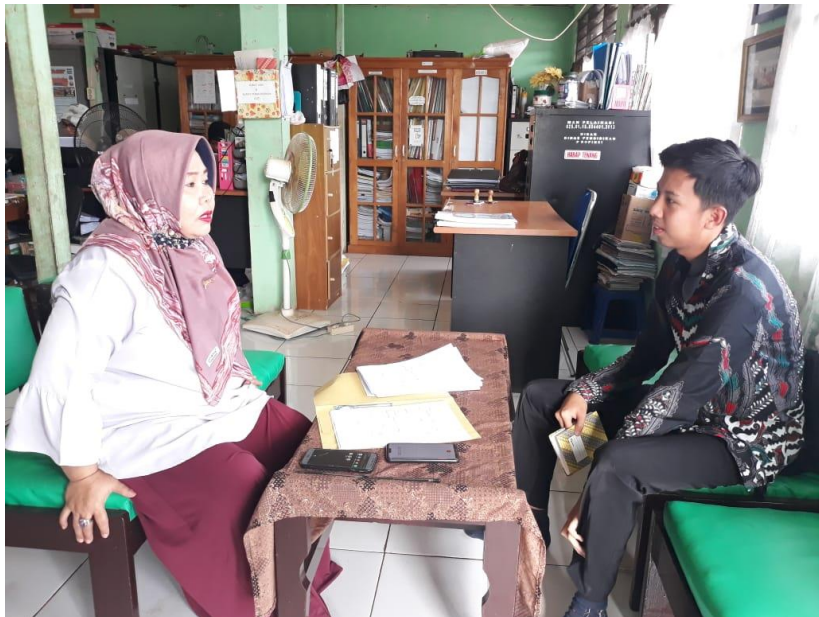
(wawancara dengan Kepala Sekolah MAN Tanah Laut)