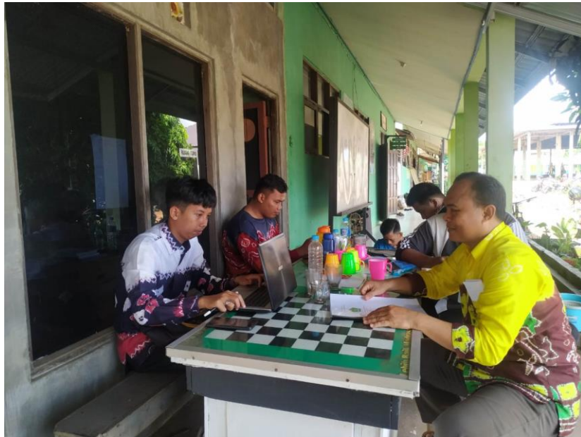
(Wawancara dengan guru fikih kelas X di MAN Tanah Laut)