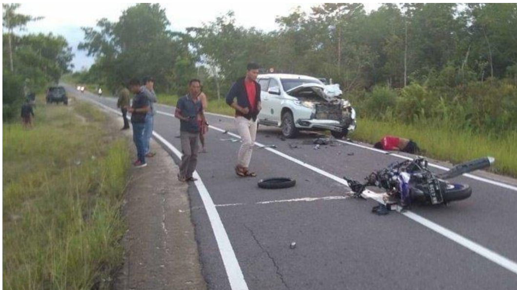
Foto kecelakaan sepeda motor akibat tidak menggunakan helm