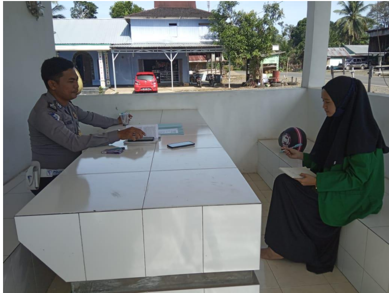
Foto bersama salah satu pengendara sepeda motor yang memakai helm dan yang tidak memakai helm

Foto bersama anggota sat lantas wilayah kecamatan kelumpang barat, kabupaten kotabaru