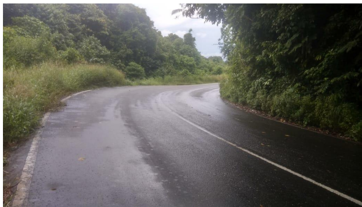
Foto-foto tikungan yang tidak diberi rambu-rambu lalu lintas