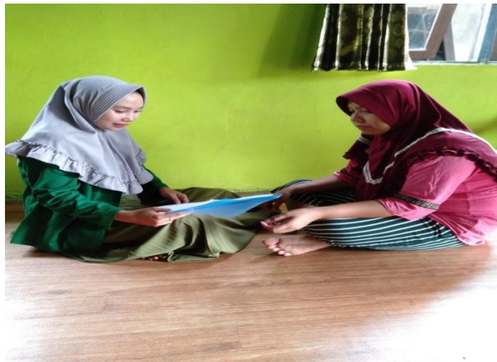
FOTO SAAT WAWANCARA DENGAN