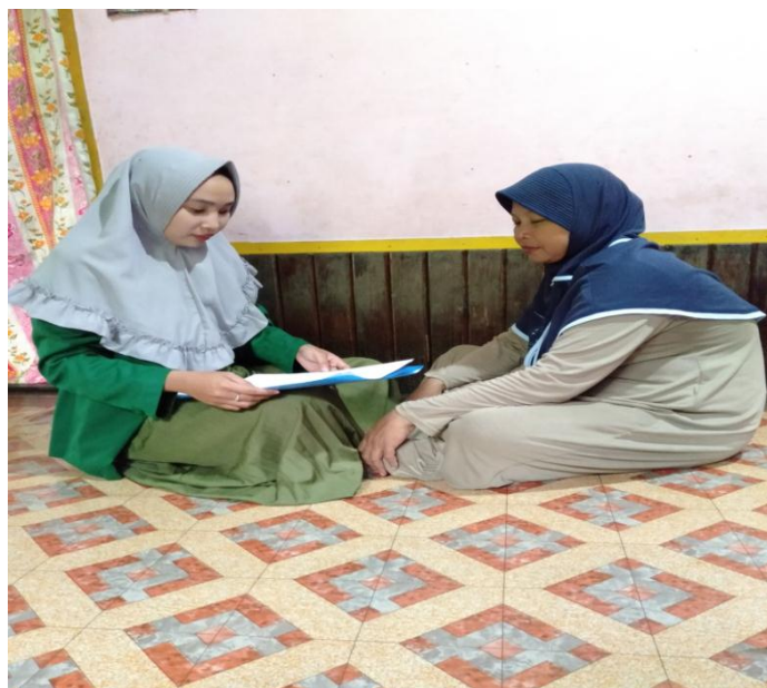
FOTO SAAT WAWANCARA DENGAN