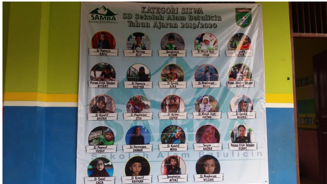
(Gambar katagori peserta didik di Sekolah Alam Batulicin Kabupaten Tanah Bumbu)