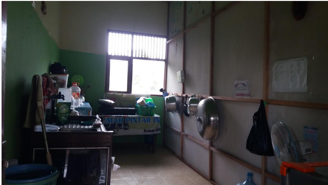
(Gambar dapur di Sekolah Alam Batulicin Kabupaten Tanah Bumbu)