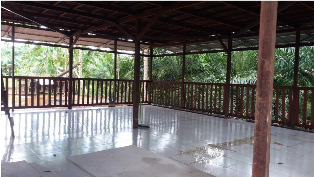
(Gambar Ruang belajar lantai 1 di Sekolah Alam Batulicin Kabupaten Tanah Bumbu)