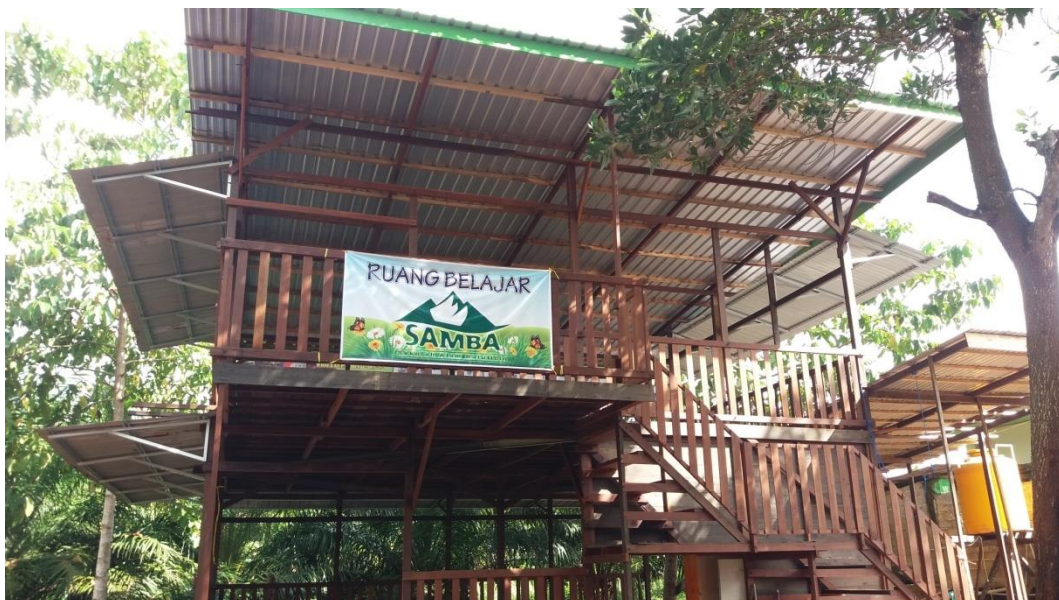
(Gambar Ruang belajar di Sekolah Alam Batulicin Kabupaten Tanah Bumbu)