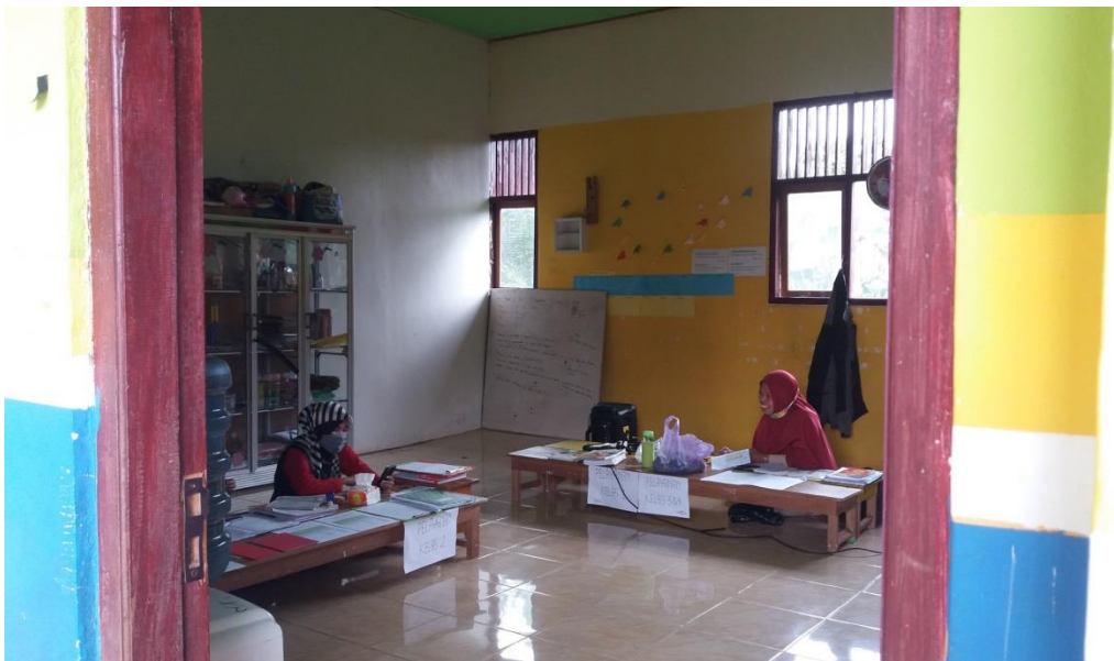
(Gambar kantor di Sekolah Alam Batulicin Kabupaten Tanah Bumbu)