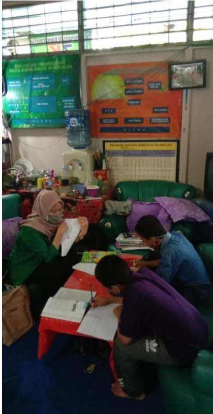
siswa lambat belajar sedang mengisi angket tingkat kepercayaan diri