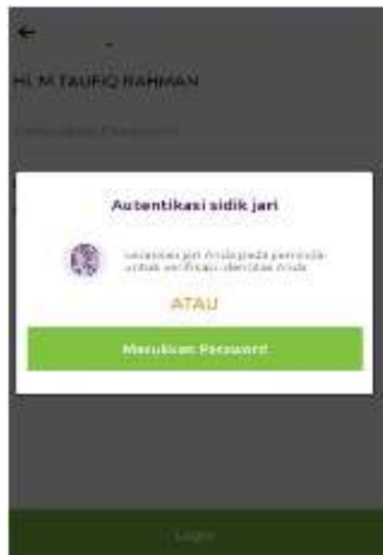
Gambar 2.2 Tampilan Bagian Dalam Aplikasi Mobile Banking Bank Muamalat