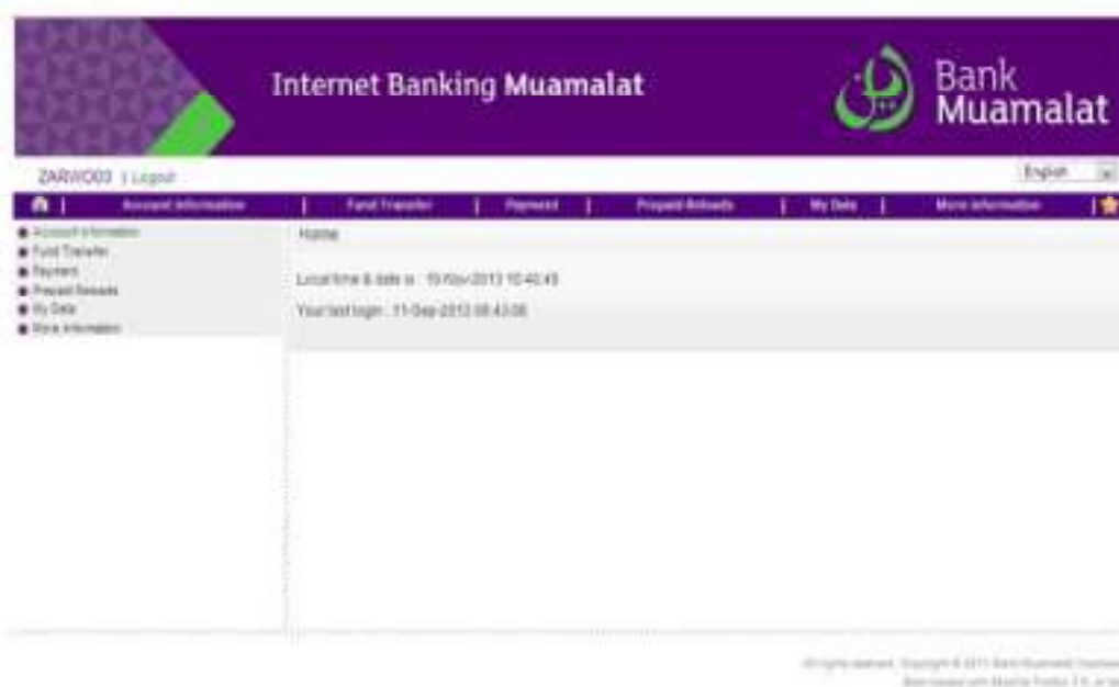
Gambar 2.5 Tampilan Bagian Dalam Aplikasi Internet Banking Bank Muamalat Indonesia

Tampilan dalam atau setelah masuk situs Internet Banking Muamalat terdapat berbagai layanan yang dapat dilakukan nasabah sesuai kebutuhan yang diinginkan, seperti layanan informasi, transfer, pembayaran, data nasabah, serta informasi lainnya.