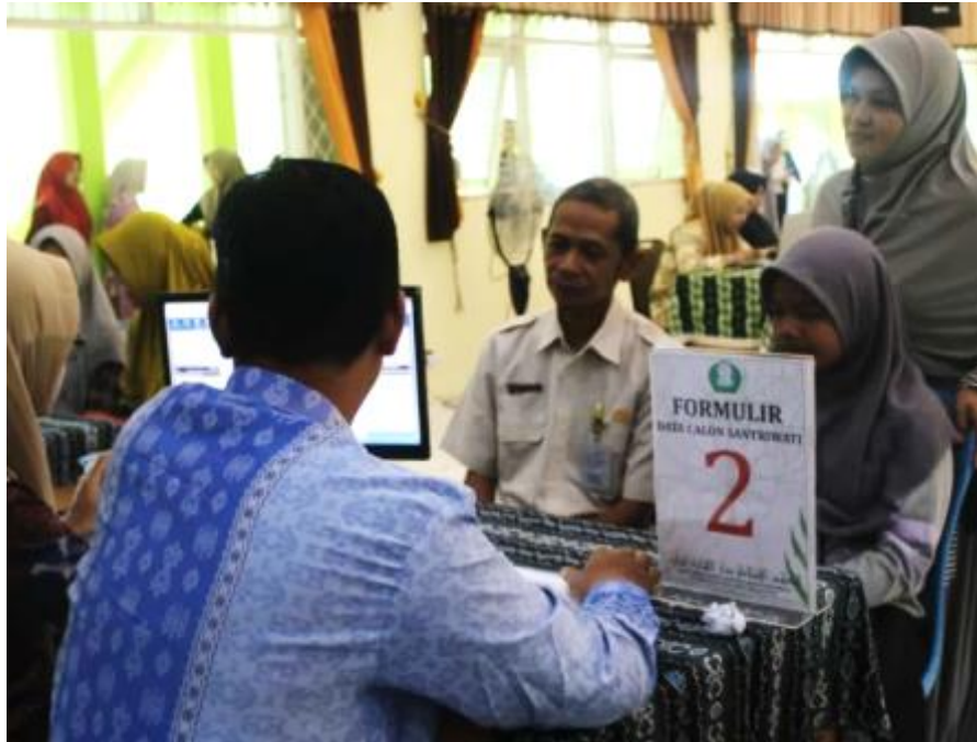
Gambar 15 Proses Penerimaan Santriwati Baru Pondok Pesantren Darul Hijrah Putri