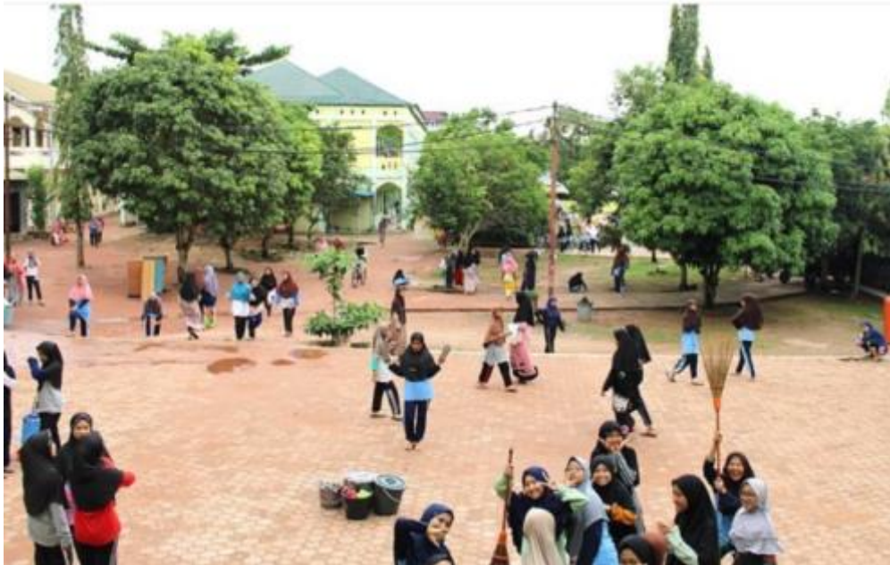
Gambar 08 Kegiatan bersih-bersih oleh santri Pondok Pesantren Darul Hijrah Putri setiap hari ahad pagi