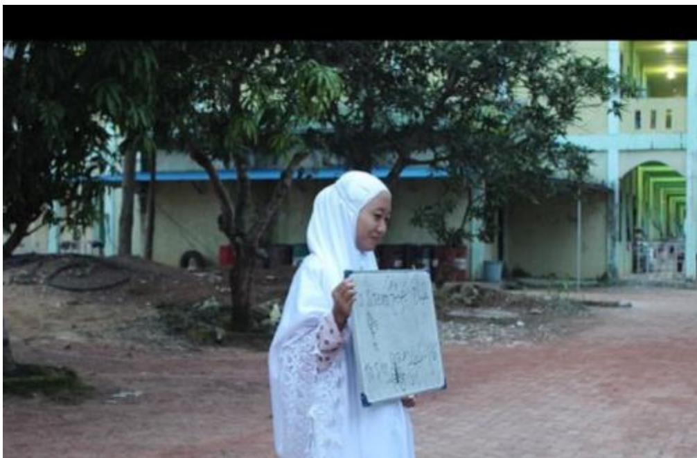
Gambar 10 Kegiatan pemberian kosa kata setiap bada shalat subuh oleh pengurus bagian bahasa asrama