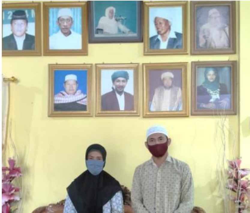
Gambar 23 Wawancara dengan Tata usaha Pondok Pesantren Al Falah Putri Banjarbaru