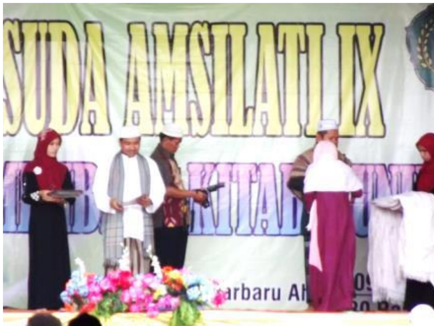
Gambar 26 Kegiatan Wisuda Amsilati Pondok Pesantren Al Falah Putri Banjarbaru