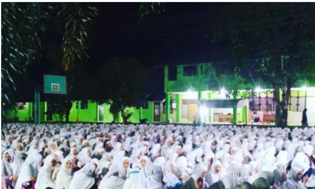
Gambar 12 Kegiatan pemberian motivasi dan arahan secara umum oleh Pimpinan Pondok Pesantren Darul Hijrah Putri pada malam-malam tertentu