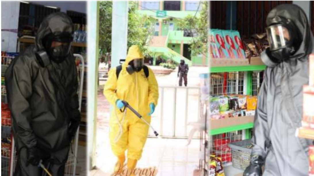
Gambar 11 Kegiatan ekstra penyemprotan disinfektan upaya pencegahan virus corona di seluruh area Pondok Pesantren Darul Hijrah Putri