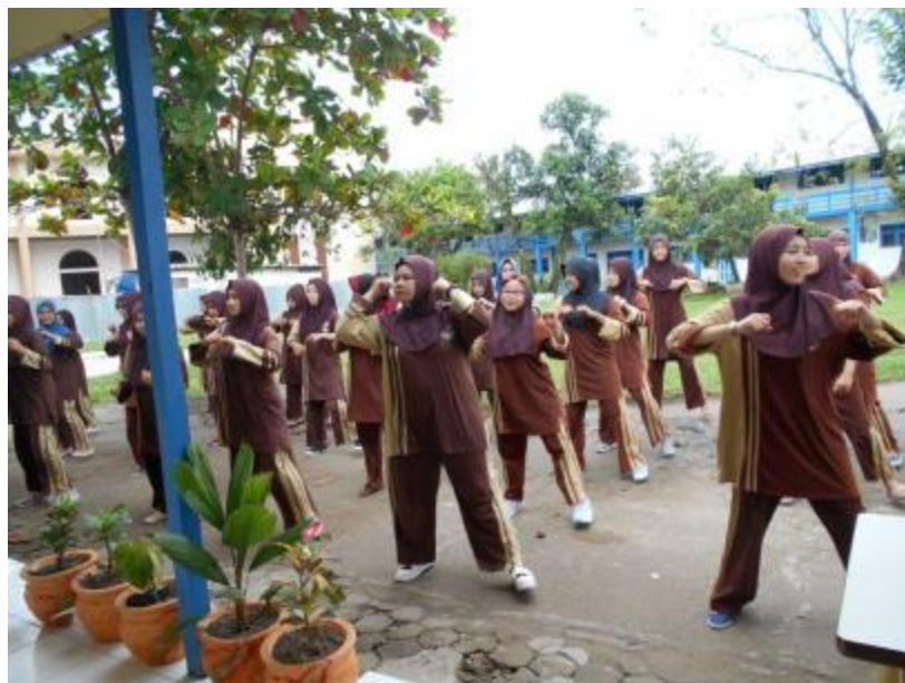
Gambar 24 Kegiatan Senam oleh Santriwati Pondok Pesantren Al Falah Putri Banjarbaru