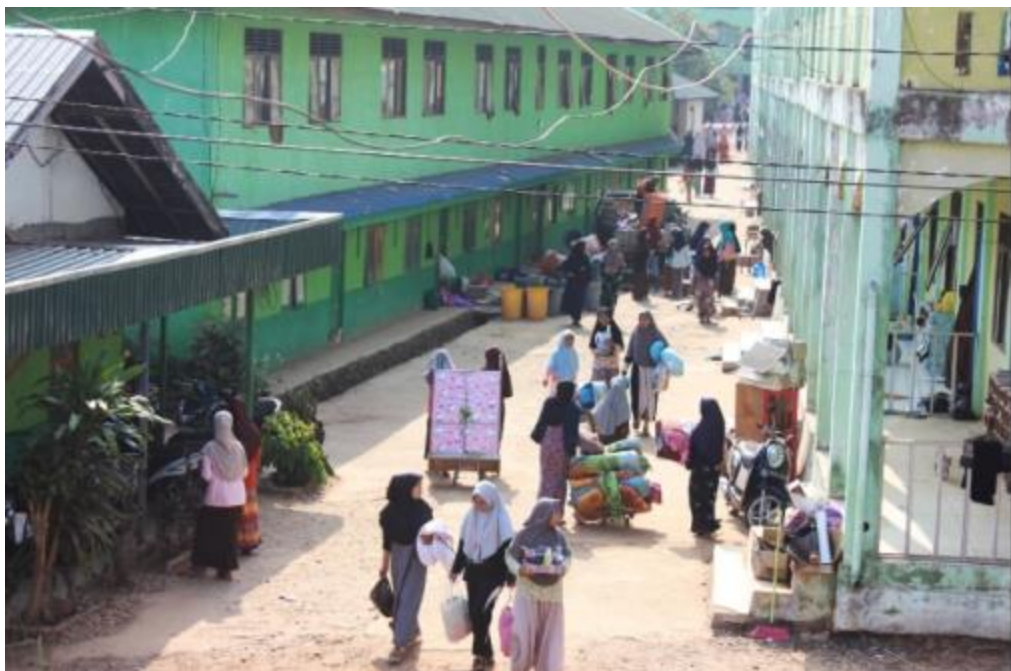
Gambar 16 Suasana perpindahan kamar di Pondok Pesantren Darul Hijrah Putri