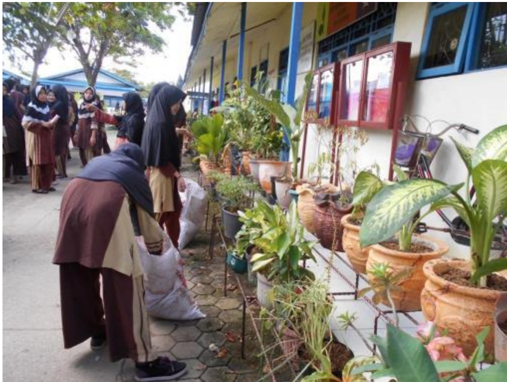
Gambar 17 Kegiatan Pembersihan umum oleh santri Pondok Pesantren Al Falah Putri Banjarbaru