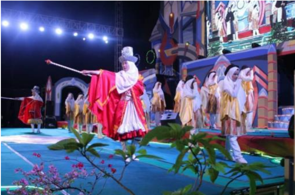
Gambar 05 Kegiatan Panggung Gembira pada Pekan Perkenalan Khutbatul Arsy