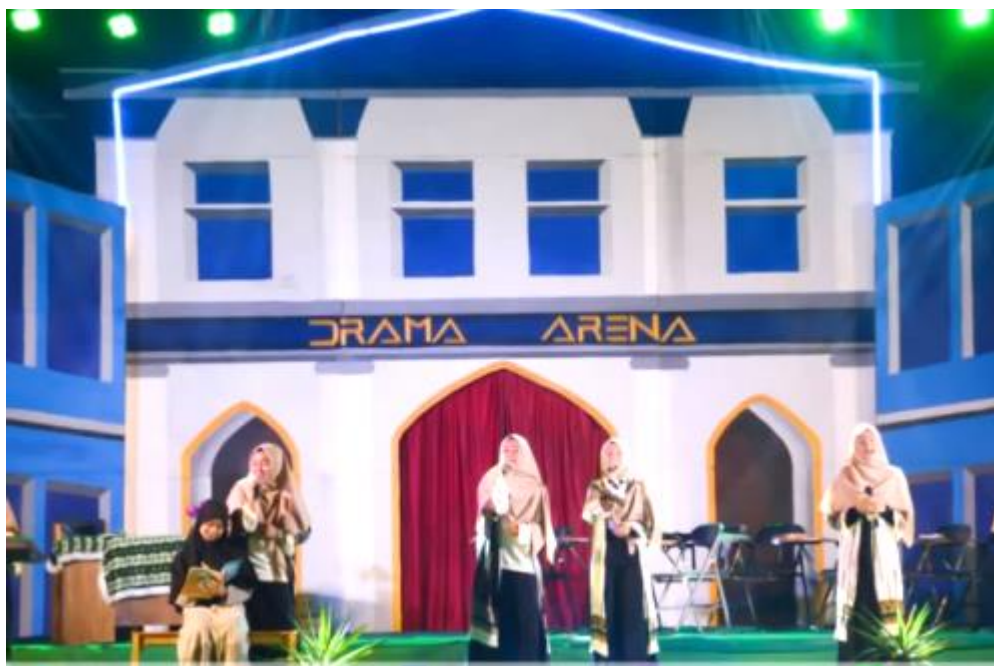
Gambar 06 Kegiatan Drama Arena pada Pekan Perkenalan Khutbatul Arsy