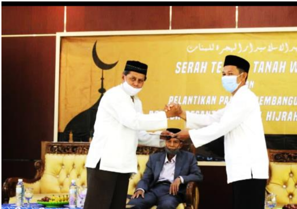
Gambar 03 Serah Terima Tanah Wakaf bagian dari usaha pondok dalam perluasan wakaf Pondok Pesantren Darul Hijrah Putri