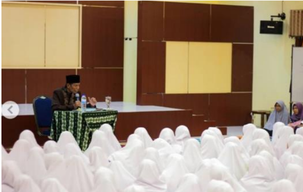
Gambar 13 Pengarahan oleh Pimpinan Pondok Pesantren Darul Hijrah Putri kepada Pengurus OSDA, Pengurus Rayon, dan Pengurus Pramuka