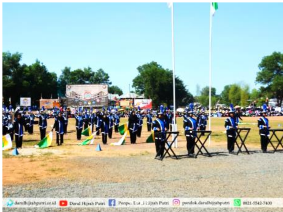
Gambar 04 Kegiatan Apel Tahunan di Pondok Pesantren Darul Hijrah Putri