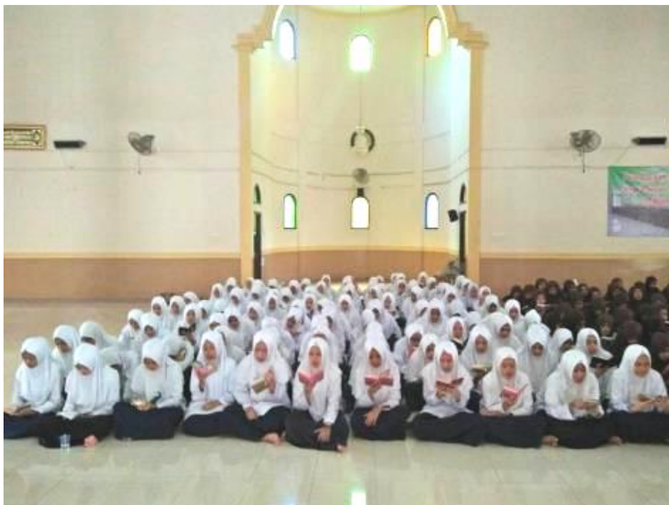
Gambar 26 Kegiatan Kepesantrenan di Pondok Pesantren Al Falah Putri