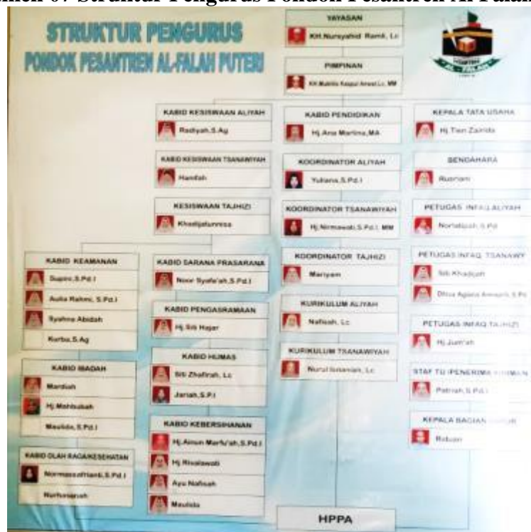
Dokumen 07 Struktur Pengurus Pondok Pesantren Al Falah Puteri

PENERIMAAN SANTRIWATI BARU thn ajaran 2020/2021 pd tgl 3 -9 maret 2020(pembagian formulir dan tes) Tgl 15 maret pngummn hasil tes. Tgl 24 maret-29 maret daftar ulang.