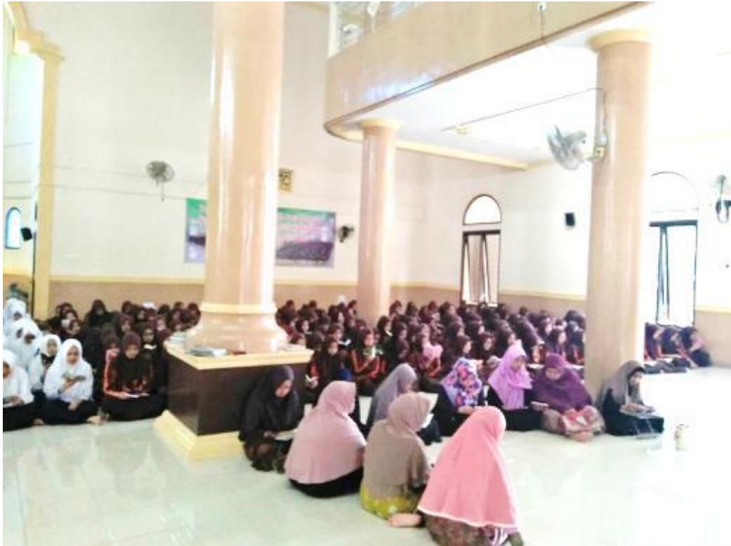
Gambar 25 Kegiatan Rutin di Musala Pondok Pesantren Al Falah Putri Banjarbaru