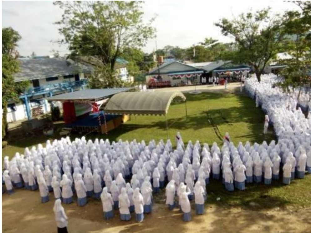
Gambar 25 Kegiatan Tahunan dalam memperingati ulang tahun Pondok Pesantren Al Falah Putri Banjarbaru