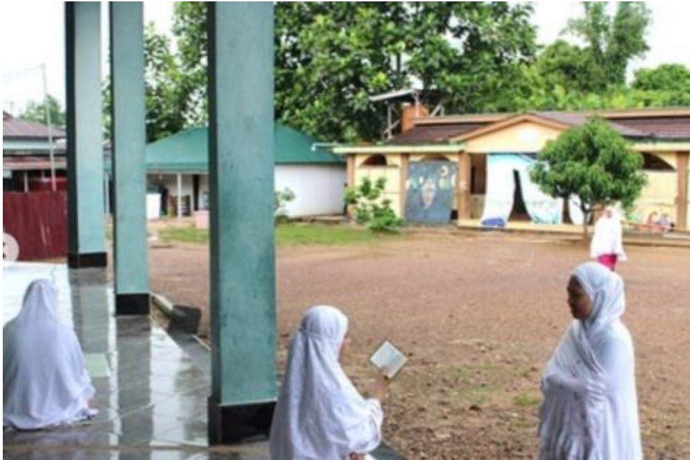
Gambar 09 Kegiatan ekstra kurikuler Hifzu al-quran di Pondok Pesantren Darul Hijrah Putri setiap sore