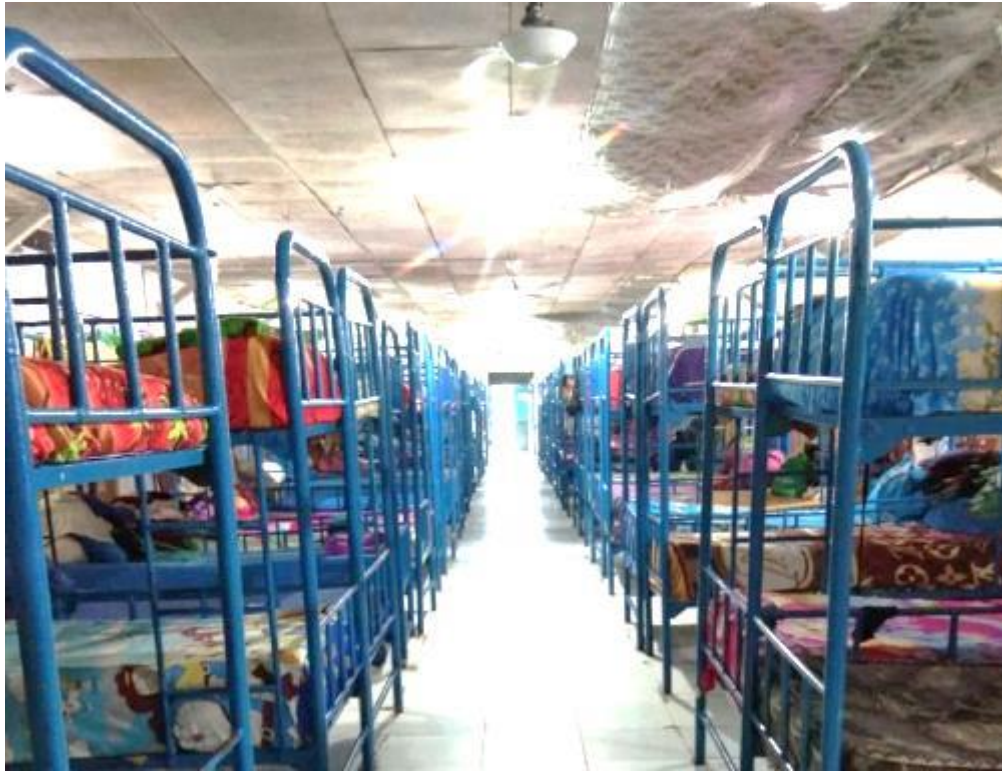
Gambar 19 Keadaan Asrama Pondok Pesantren Al Falah Putri Banjarbaru