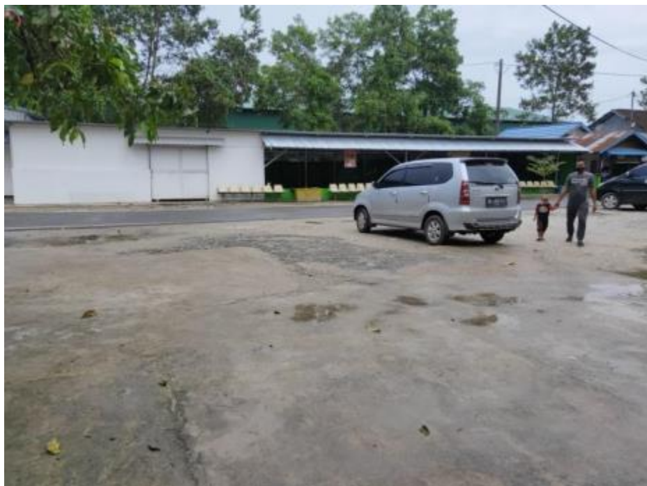
Gambar 22 keadaan Lahan Parkir, Tempat Bertamu Pondok Pesantren Al Falah Putri Banjarbaru