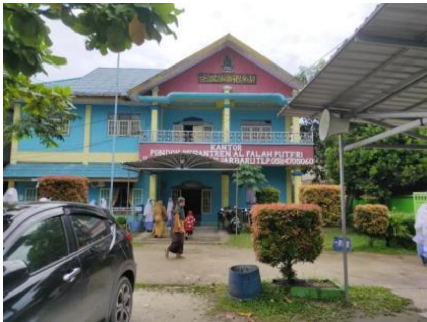
Gambar 18 keadaan Kantor Pondok Pesantren Al Falah Putri Banjarbaru