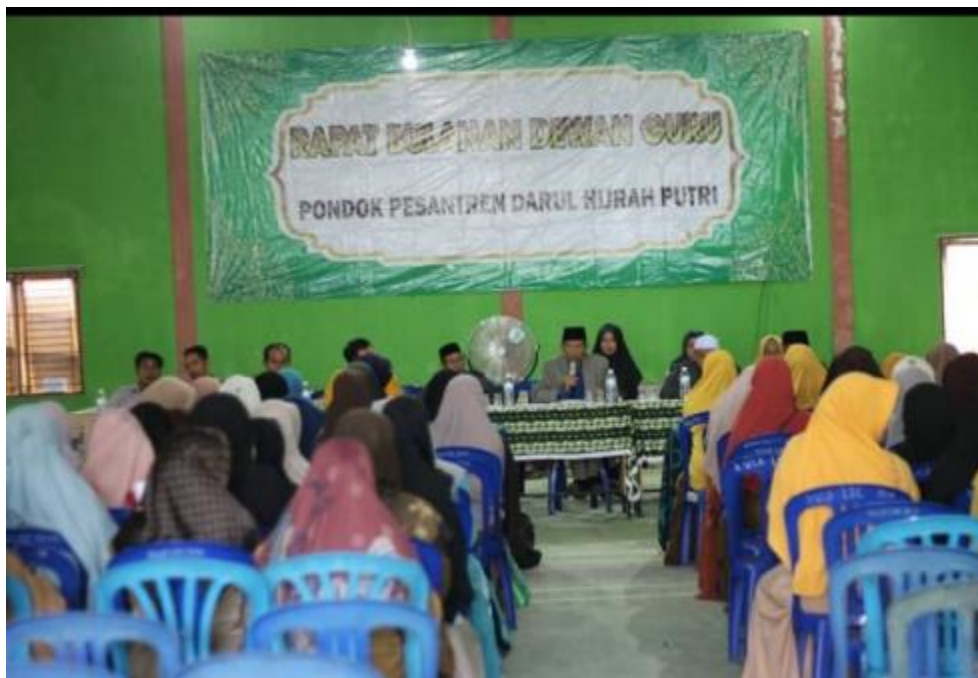
Gambar 14 Pengarahan dan Pembinaan kepada seluruh guru Pondok Pesantren Darul Hijrah Putri