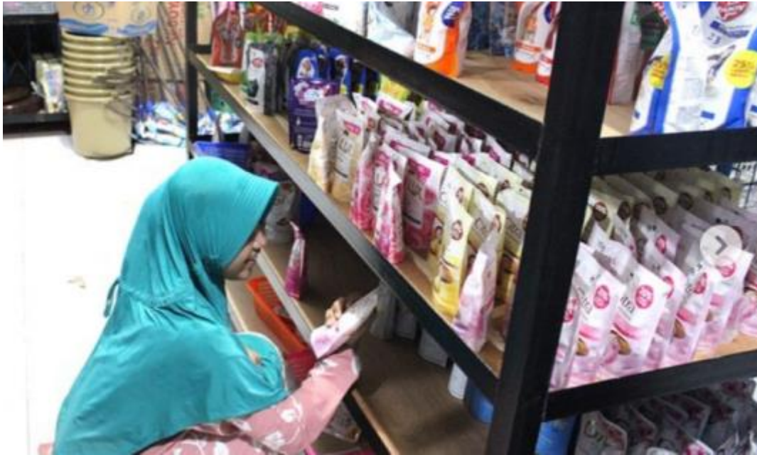
Gambar 07 Salah satu Unit Usaha Pondok Pesantren Darul Hijrah Putri