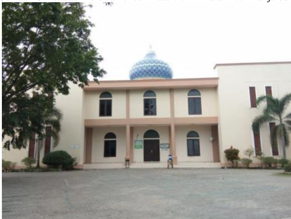
Gambar 20 keadaan Musala Pondok Pesantren Al Falah Putri Banjarbaru