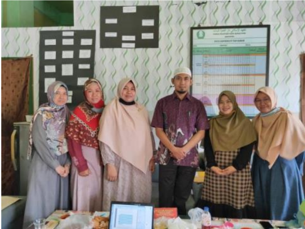
Gambar 01 foto bersama setelah wawancara dengan Kepala Biro Pengasuhan Santriwati dan Penanggung Jawab 4 Asrama