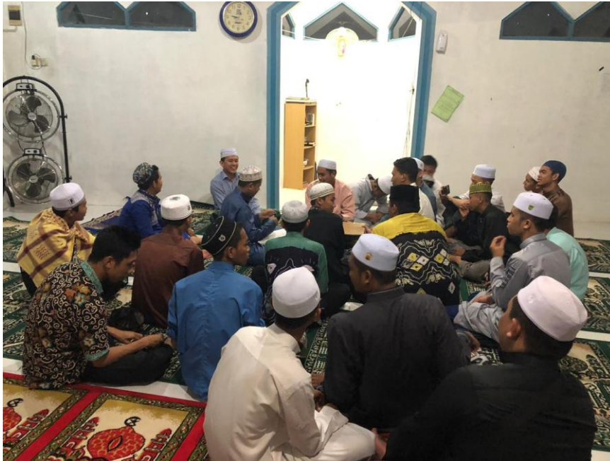
Gambar 1 : Program Pembelajaran Sejarah Islam (Ta'lim Akhir)