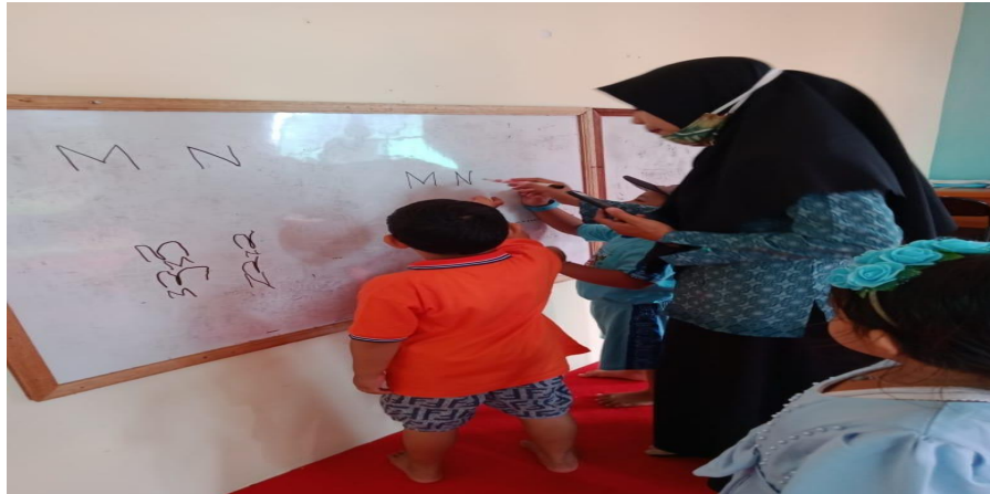
CD.V Gambar kegiatan belajar sekaligus proses terapi anak autis untuk melatih kemandirian anak

Memasuki kegiatan ke dua membaca bacaan surah 08.45-09.30. Setelah tiba jam 08.45-09.30, anak di minta membaca surah-surah pendek secara bergantian dan bagi anak anak yang kena giliran membaca surah maka anak memimpin teman-temannya untuk membaca surah dengan suara yang keras, setelah semua surah pendek terbaca maka ibu guru meminta anak kembali ke kelas masing-masing sesuai kelompok mereka, setelah anak sudah berada di ruangan berbeda guru kelas membahas tentang tema yang akan di bahas pada hari ini, dan mereka belajar sesuai tema yang sudah di tentukan.