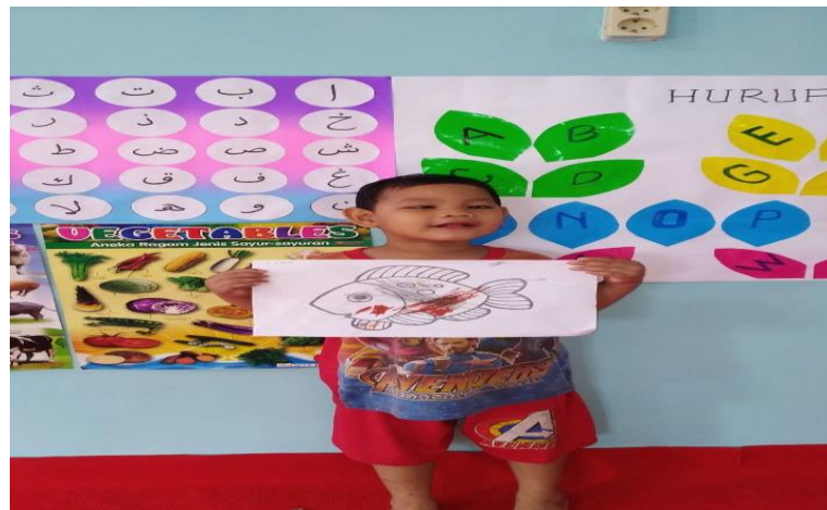
CD.VIII.Gambar kegiatan anak autis mewarnai gambar

dalam kelas tersebut, setelah mereka main sekitan 20 menit anak-anak di minta berkumpul duduk melingkar untuk makan snack yang sudah di sediakan guru, sambil menunggu guru membagikan snack anak-anak di minta duduk yang rapi sambil memegang mangkuk kosong siapa yang paling rapi itu yang dapat duluan snacknya dari ibu guru.