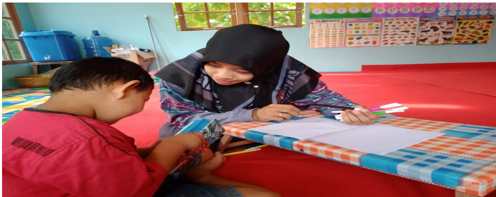
CD.I Gambar kegiatan belajar sekaligus proses terapi anak autis

Hasil dokumentasi saat pembelajaran sedang berlangsung, di peroleh data bahwa penerapan metode terapi di KB Syamsi Syumus dapat di lihat dari cara guru dalam menangani anak autis tersebut sehingga perkembangan anak ada perbaikan dari sebelumnya.