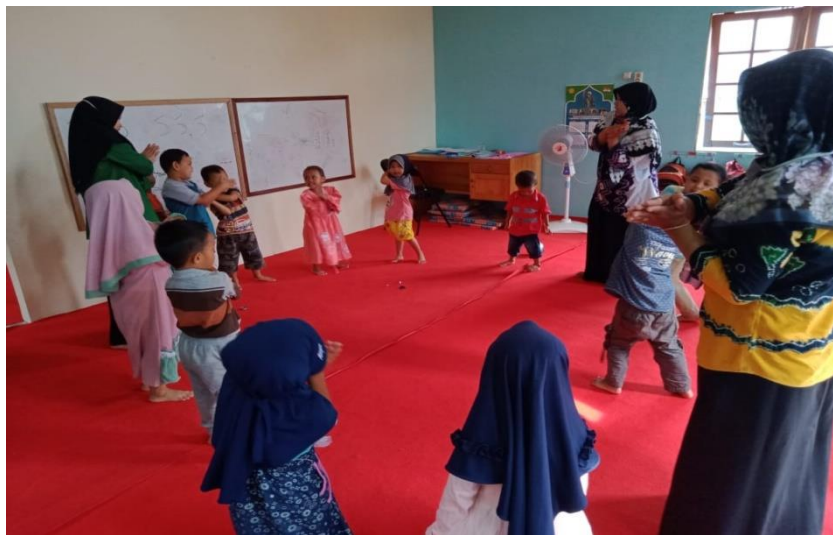
CD.II Gambar kegiatan anak-anak bermain bersama sebelum kegiatan belajar

telah di sediakan tersebut sesuai dengan kelas masing-masing, sambil menunggu teman-teman yang lain datang mereka bermain di dalam kelas bersama teman-teman selanjutnya anak bersiap untuk berkumpul membuat lingkaran sambil bernyanyi sampai semua anak rapi, setelah mereka rapi semua anak di persilahkan duduk dengan rapi, setelah rapi mereka membaca doa-doa harian secara bergantian.