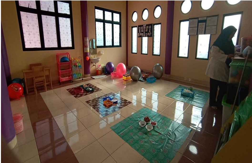
Gambar 4.3. Ruang sumber sudah disusun sebelum anak-anak masuk kelas.