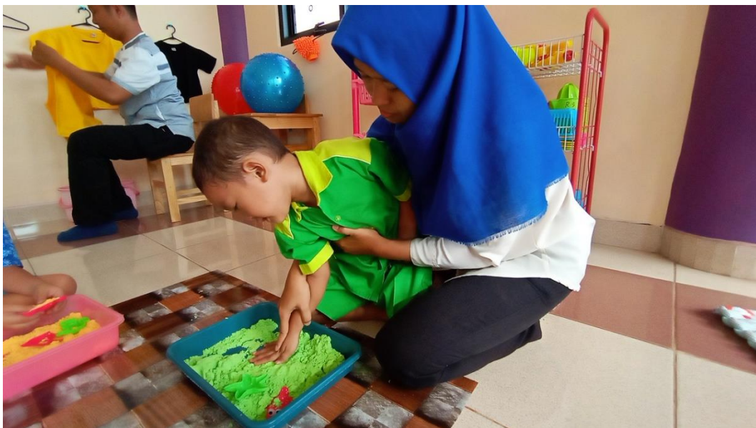
Gambar 4.6. Anak autis dibimbing oleh GPK untuk memegang playdough .