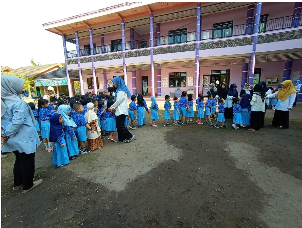
Gambar 4.2. Anak-anak bersalaman dengan semua guru sebelum masuk ke kelas masing-masing.