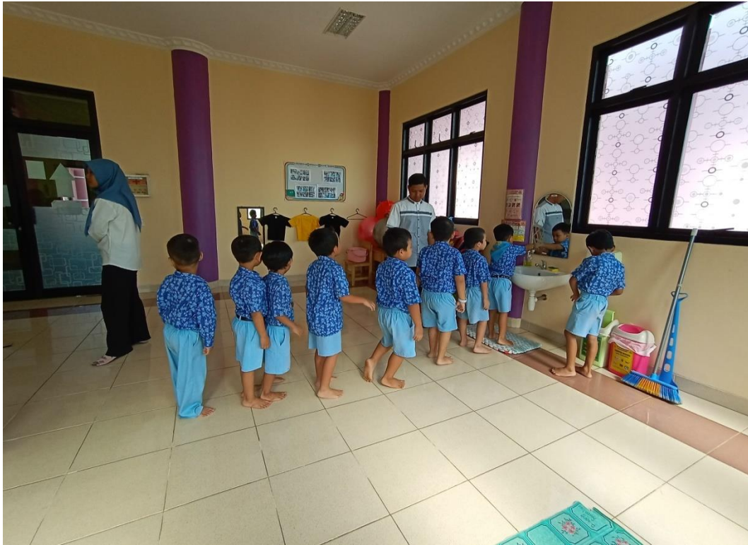
Gambar 4.5. Sebelum melakukan kegiatan anak-anak berbaris untuk mencuci tangan secara bergantian.