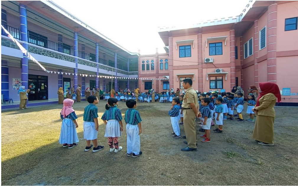
Gambar 4.1. Anak berbaris dihalaman sekolah untuk melakukan upacara dipimpin oleh guru piket.