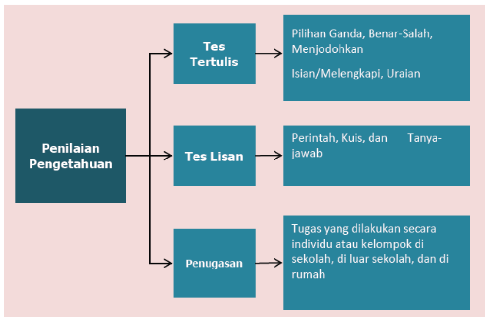
Gambar 4.2. Skema penilaian pengetahuan

Penugasan adalah pemberian tugas kepada siswa untuk mengukur dan/atau memfasilitasi siswa memperoleh atau meningkatkan pengetahuan. Penugasan yang berfungsi untuk penilaian dilakukan setelah proses pembelajaran (assessment of learning). Sedangkan penugasan sebagai metode penugasan bertujuan untuk meningkatkan pengetahuan yang diberikan sebelum dan/atau selama proses pembelajaran (assessment for learning). Tugas dapat dikerjakan baik secara individu maupun kelompok sesuai karakteristik tugas yang diberikan, yang dilakukan di sekolah, di rumah, dan di luar sekolah. Skema penilaian pengetahuan dapat dilihat pada Gambar 4.2.