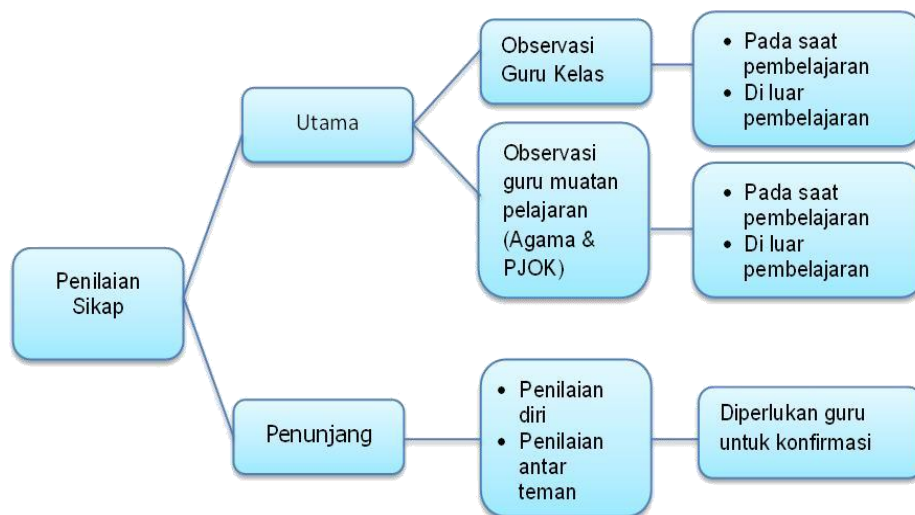
Gambar. 4.1 Skema penilaian sikap

Teknik penilaian Jurnal dilakukan dengan menilai hasil kumpulan catatan atau keberhasilan dalam suatu kegiatan dengan memperhatikan beberapa aspek, yaitu: catatan dasar atau kelengkapan catatan, ketepatan waktu, pengembangan indikator yang tinggi, sedang dan rendah, penilaian jurnal pada kriteria lainnya, dan menambahkan penilaian untuk kriteria bersama lainnya untuk menentukan nilai total. Berikut skema penilaian sikap gambar 4.1.