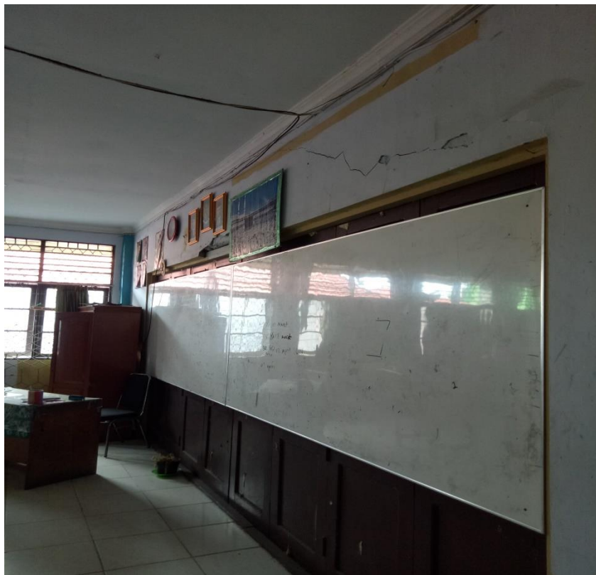
Kondisi Ruang Kelas MAN 1 Banjarmasin