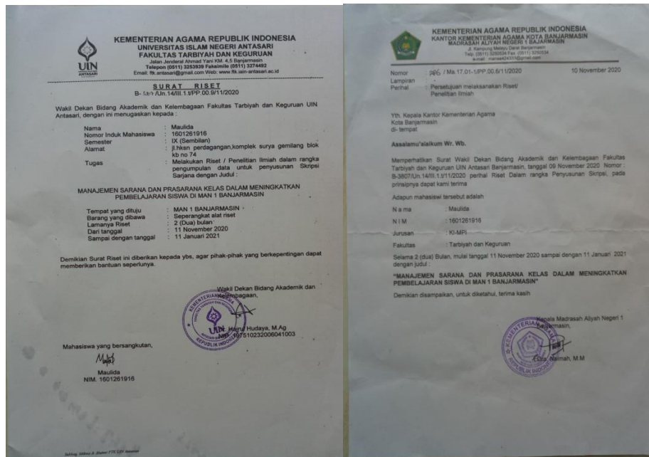
Surat Riset dan Selesai Riset