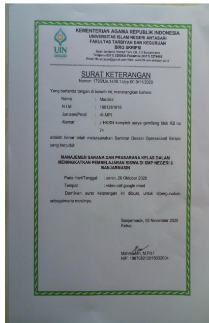
Surat Selesai Seminar