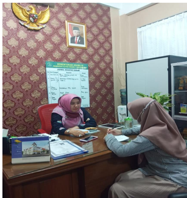
Wawancara Kepala Madrasah