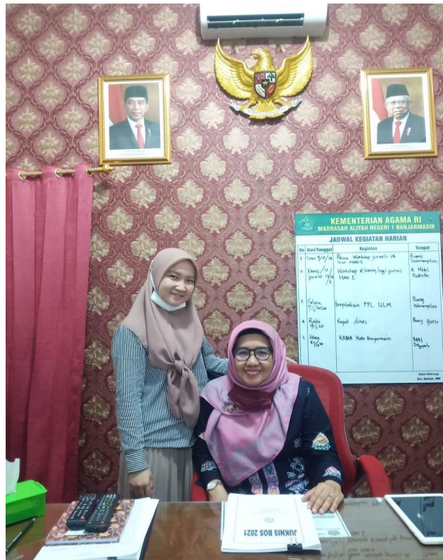
Photo Bersama Kepala Madrasah