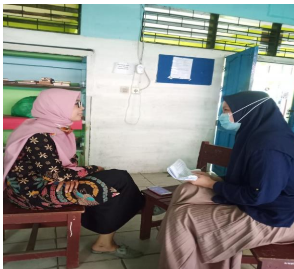
Wawancara Wakil Kepala Madrasah Bidang Sarana dan Prasarana Dan Guru