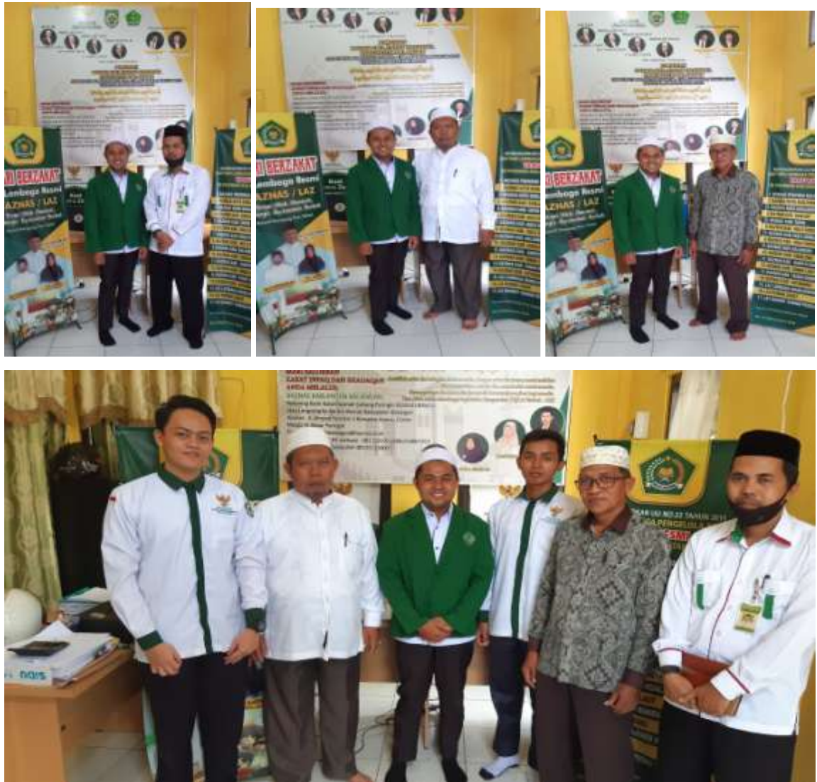
Foto Bersama pengurus BAZNAS Kab.Balangan