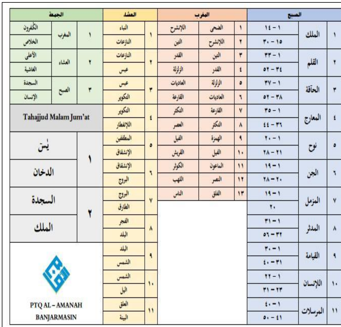
Tabel 3.8 Daftar Surah yang Harus Dibaca Santri Pondok Pesantren Tahfiz Al-Quran Al-Amanah Ketika Menjadi Imam Di Musala Al-Amanah

Agar membuat para santrinya lebih lama bersama Al-Qur'an, maka ketika