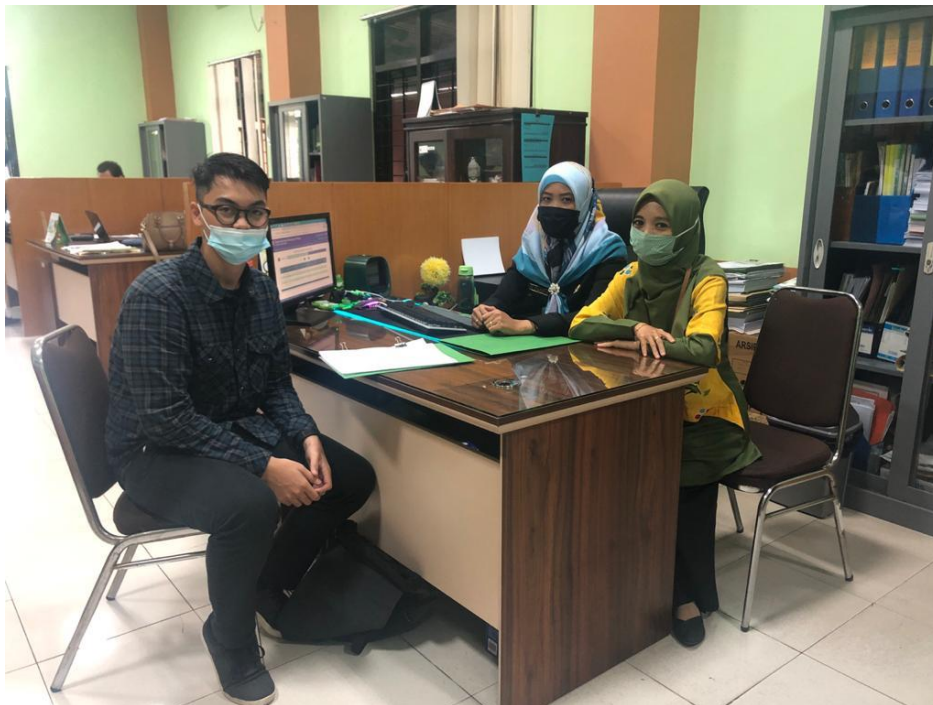
(Wawancara Penulis kepada Panitia Muda Hukum & Petugas e-register )