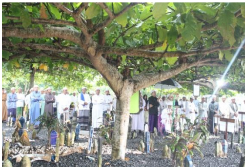
Kegiatan ziarah makam pengasuh