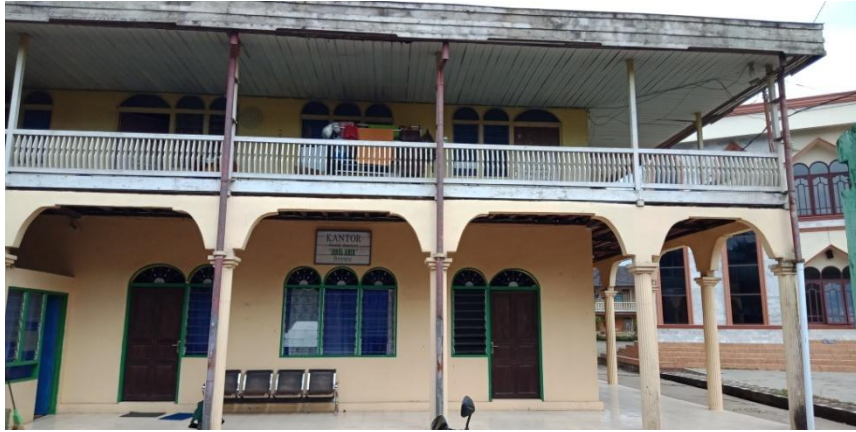
(Kantor ponpes Ibnu Amin)