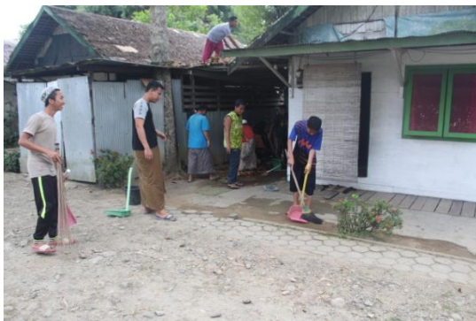
Kegiatan gotong royong