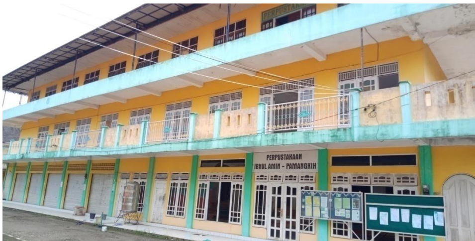
(Gedung Aula, koperasi dan perpustakaan ponpes Ibnu Amin)