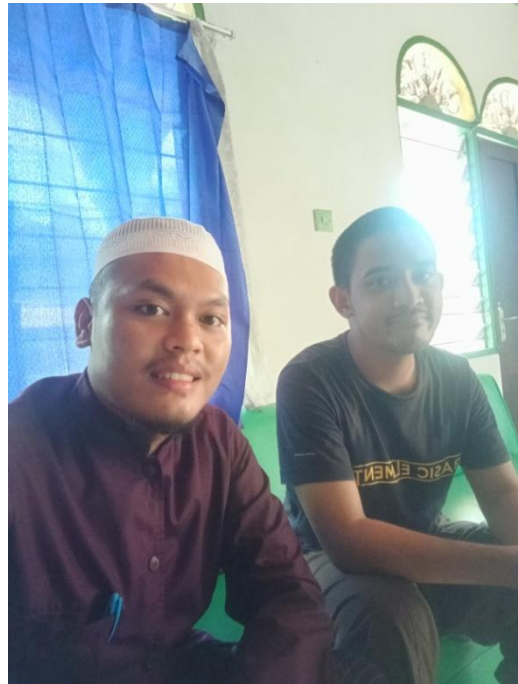
Gambar 4. Bersama Petugas Multimedia ponpes Ibnul Amin