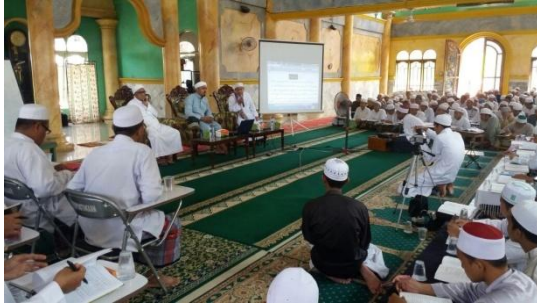
Kegiatan dakwah kedatangan habaib