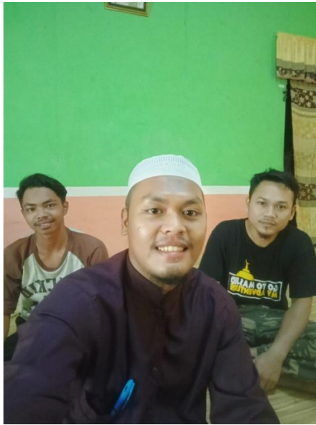
Gambar 3. Bersama Ketua Osip dan Ketua Konsul ponpes Ibnul Amin