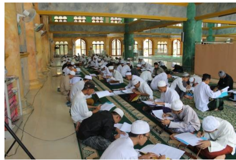
Kegiatan pembelajaran ilmu falakiyah