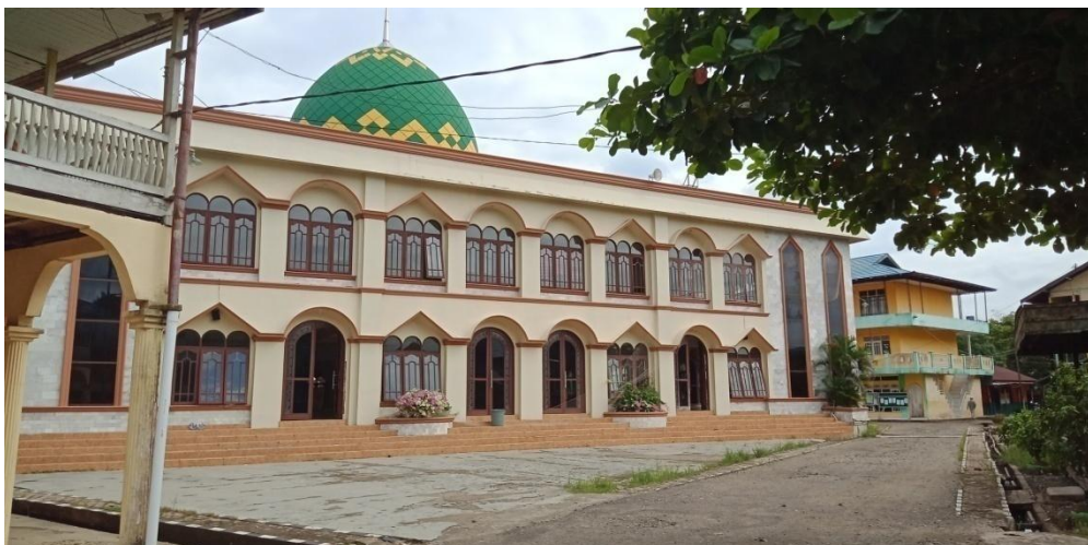
Musalla ponpes Ibnul Amin Pamangkih