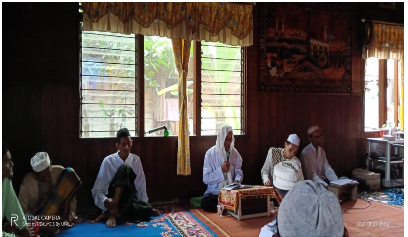
Foto saat pengajian sedang berlangsung