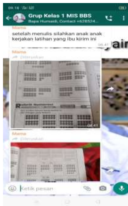
Gambar pemberian tugas dari guru/walikelas kepada siswa