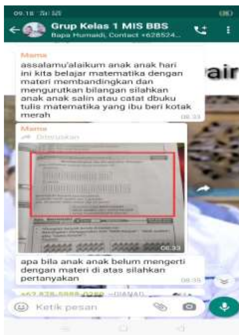
Gambar pemberian materi untuk siswa

Pemberian tugas berupa mengirimkan gambar/video/gif yang telah tersimpan sebelumnya dan apabila orangtua/siswa tidak paham maka diteruskan dengan Audio (konten ini digunakan untuk membagi file berbentuk suara).