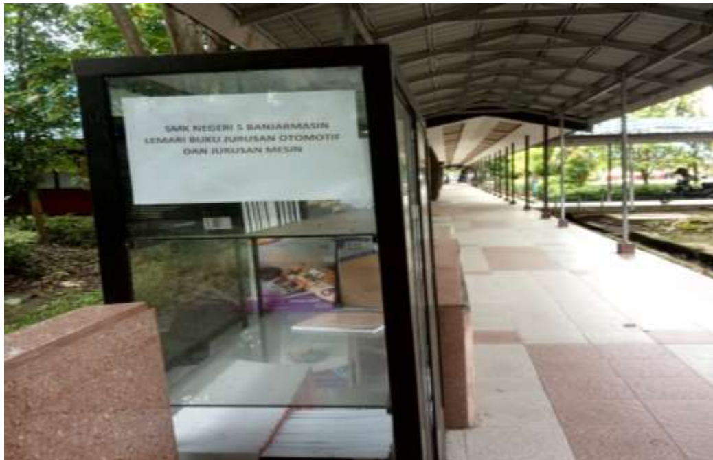
Lemari Buku Jurusan Otomotif dan Jurusan Mesin