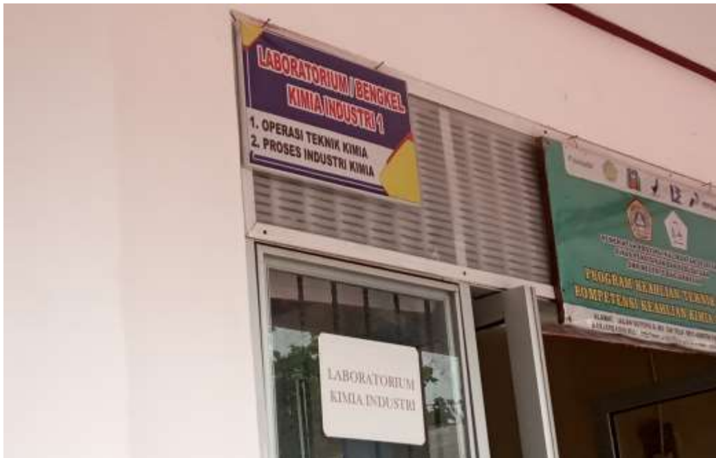
Ruang Bengkel (Laboraturium) Teknik Kimia Industri