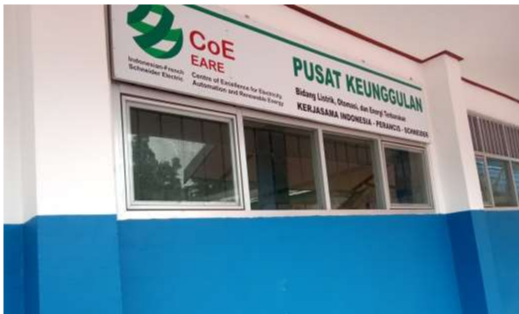
Ruang Bengkel (Laboraturium) Teknik Listrik