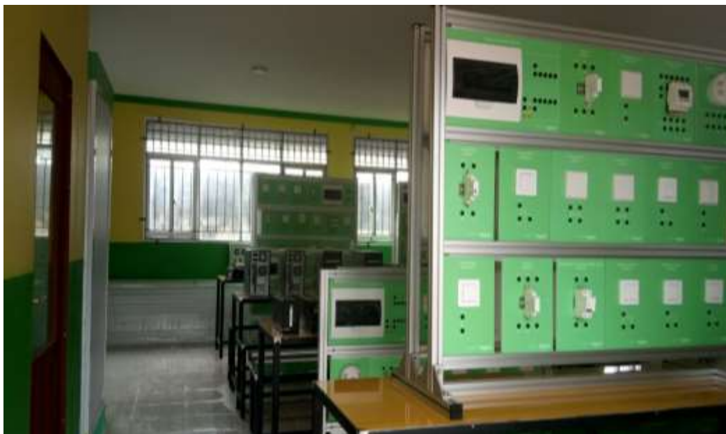
Suasana Bengkel Bidang Listrik