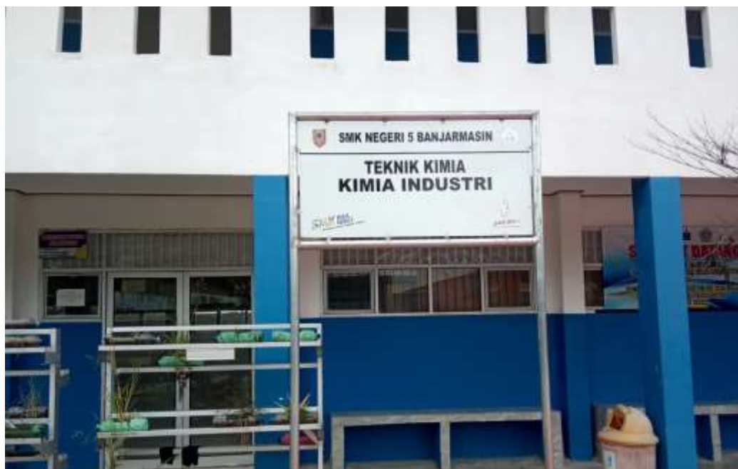
Gedung Teknik Kimia Industri