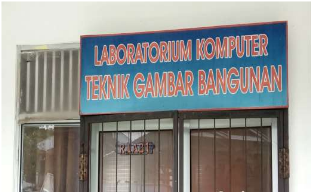
Ruang Bengkel (Laboraturium) Teknik Gambar Bangunan