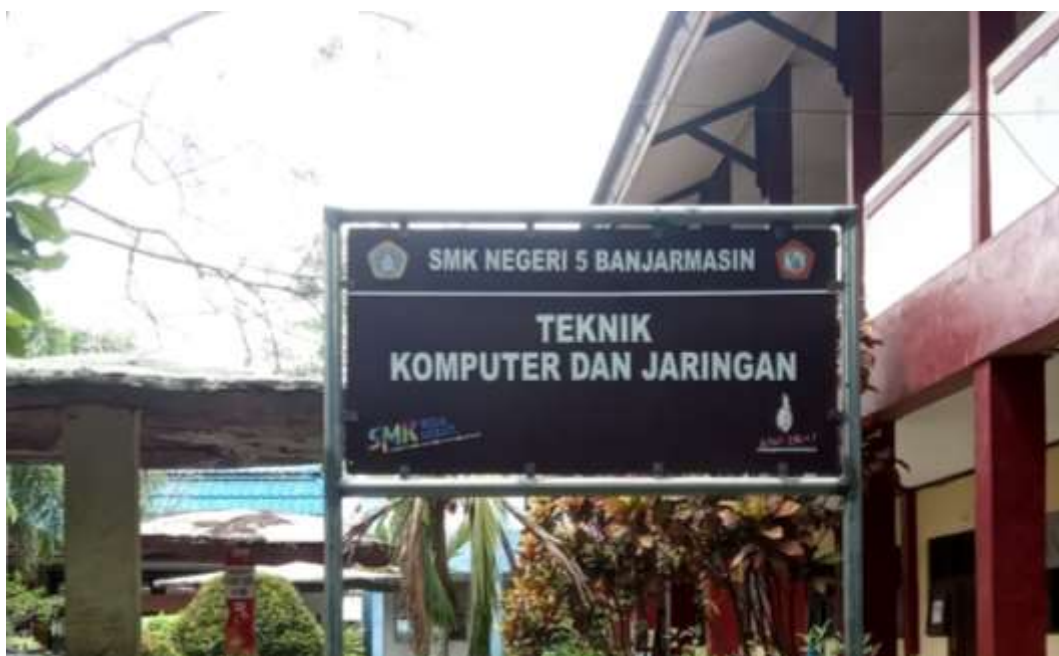
Gedung Teknik Komputer dan Jaringan