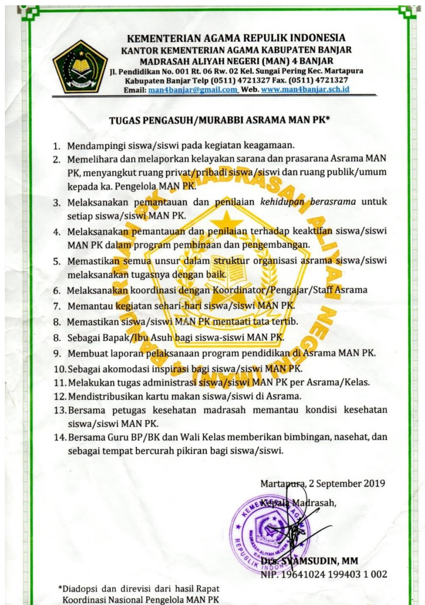
Foto Tugas pengasuh/murabbi asrama MANPK di MAN 4 Banjar tahun 2019