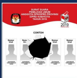
Surat suara dicoblos tapi dirusak/dilubangi.