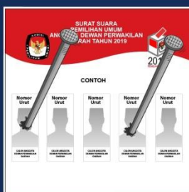
Surat suara dicoblos di lebih dari satu kolom calon.