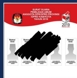
Surat suara dicoblos tapi dicoret-coret.