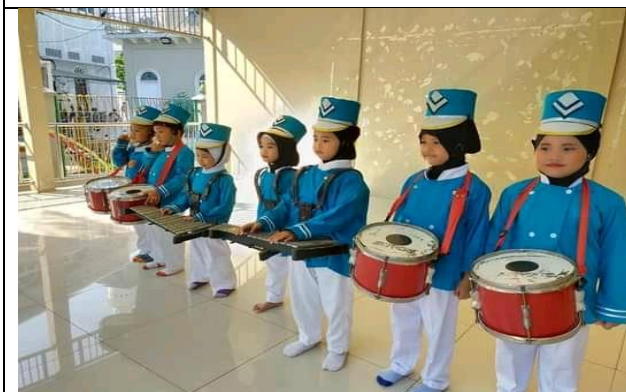
CDF1.6 Anak-anak mengikuti lomba menari diluar sekolah