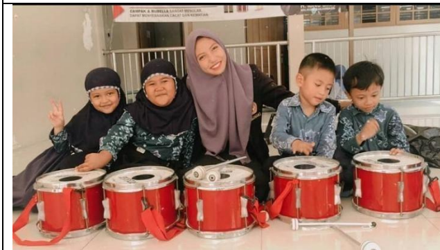
CDF1.5 Pelatih dengan anak saat memainkan alat seni musik drumband