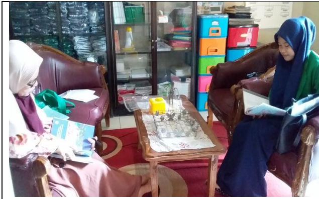
CDF1.4 Peneliti Wawancara dengan Kepala Sekolah