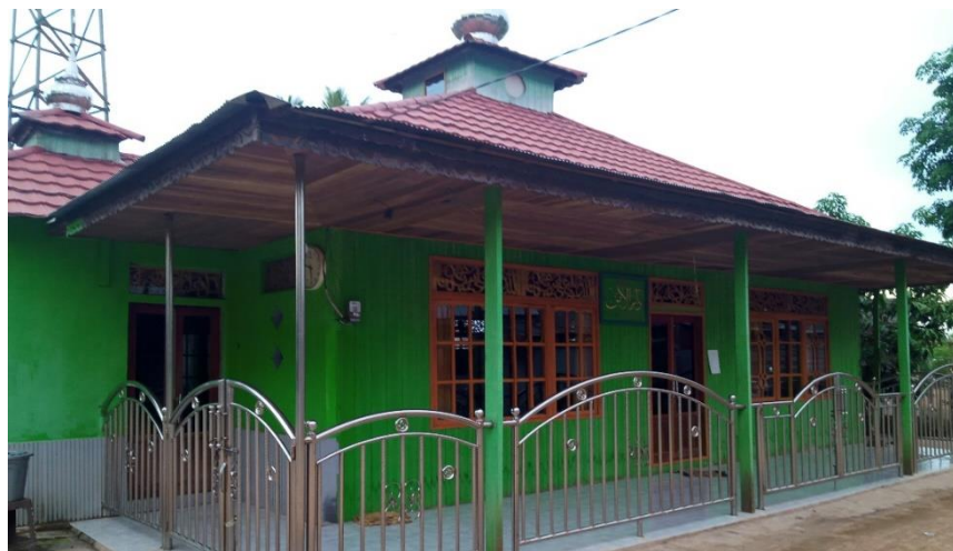
Langgar Darul Aman