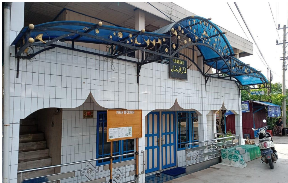
Langgar Darul Ihsan