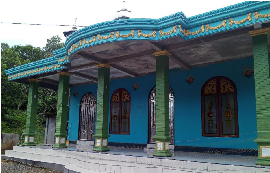
Langgar Nurul Yaqin