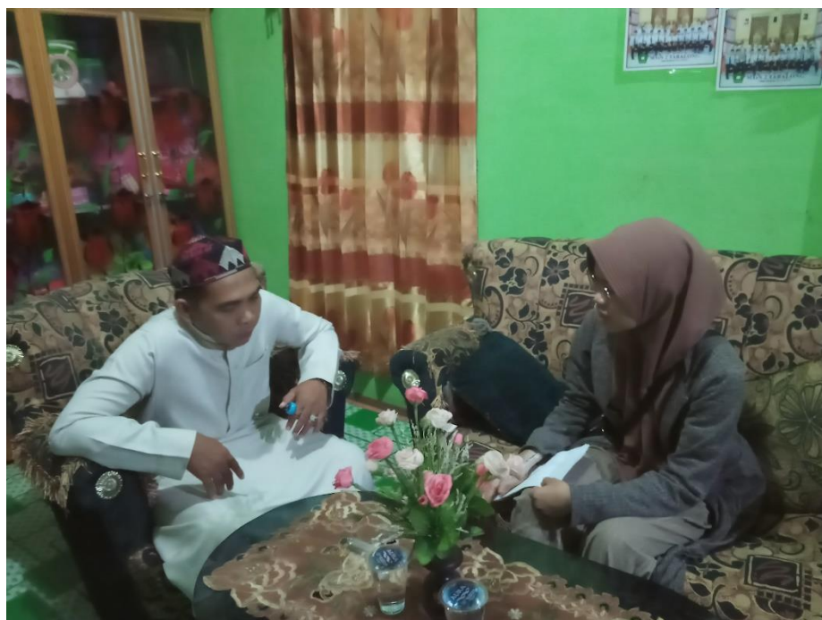
Wawancara dengan imam masjid dan langgar Kecamatan Pugaan yang menjadi sampel penelitian