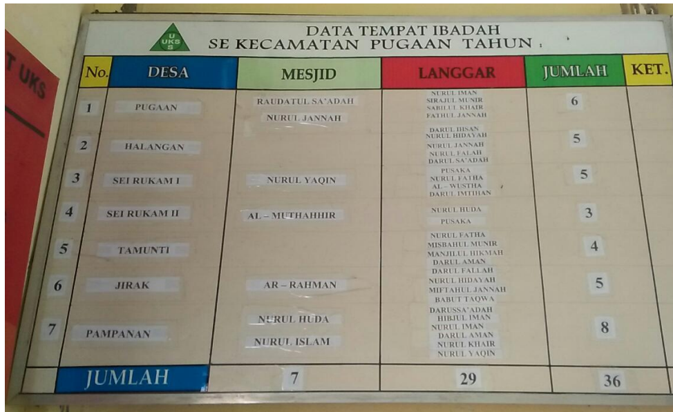
Data Tempat Ibadah Sekecamatan Pugaan