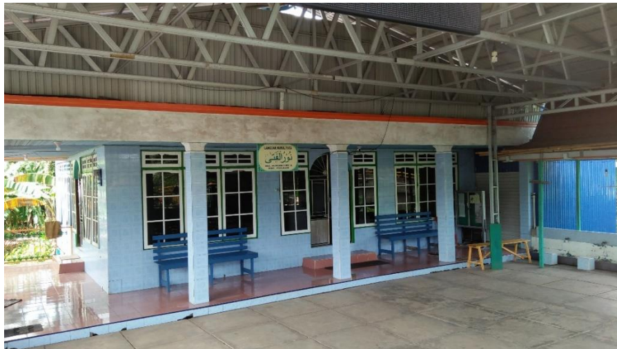
Langgar Nurul Fatha