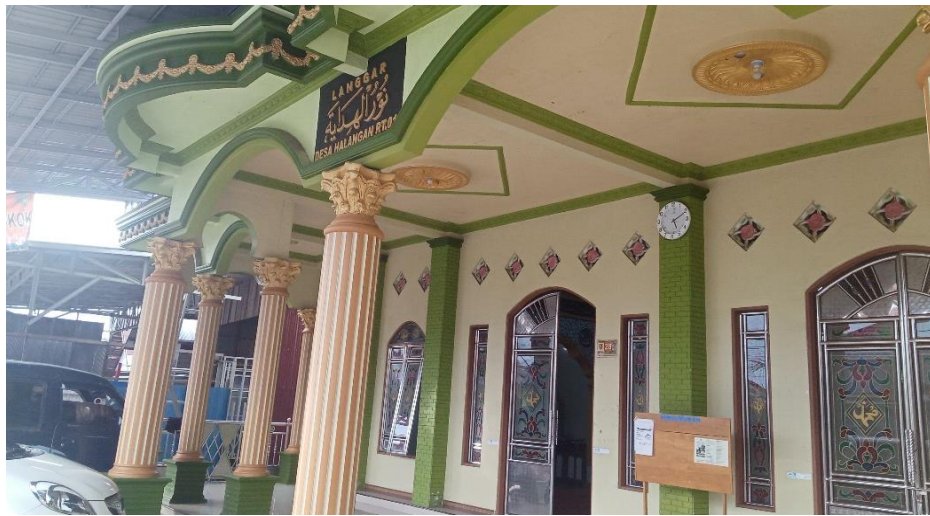
Langgar Nurul Hidayah