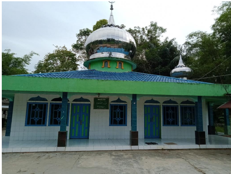
Masjid Nurul Huda