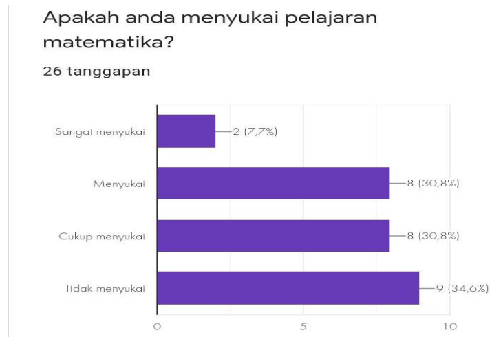
Gambar I. Diagram Pendapat Peserta Didik Terhadap Pelajaran Matematika

yang diberikan pertanyaan berupa angket kebutuhan. Sehingga di dapatkan data-data sebagai berikut: