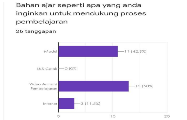
Gambar IV. Diagram Keinginan Penggunaan Media Pembelajaran

sebanyak 42,3%, sementara sisanya yaitu sebanyak 11,5% memilih media internet dan 0% memilih LKS cetak.