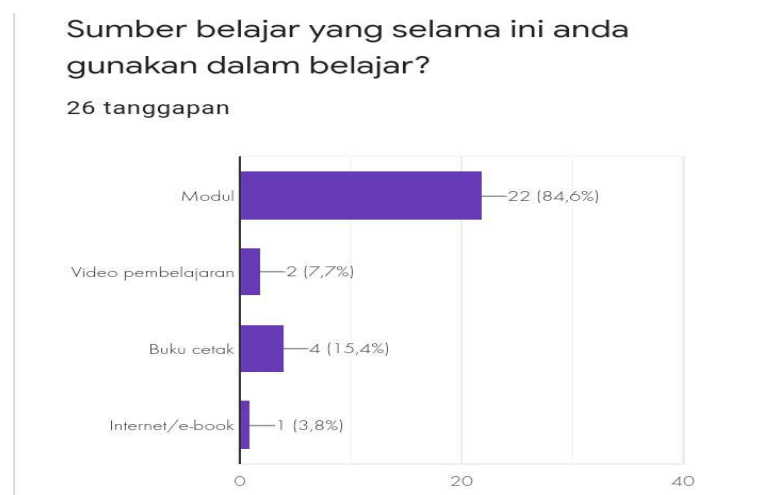
Gambar II. Diagram Sumber Belajar Peserta Didik

Berikutnya hasil dari pertanyaan angket wawancara yang diberikan kepada peserta didik menjelaskan bahwa sebagian besar, yaitu 84,6% peserta didik hanya memakai modul sebagai bahan ajar.