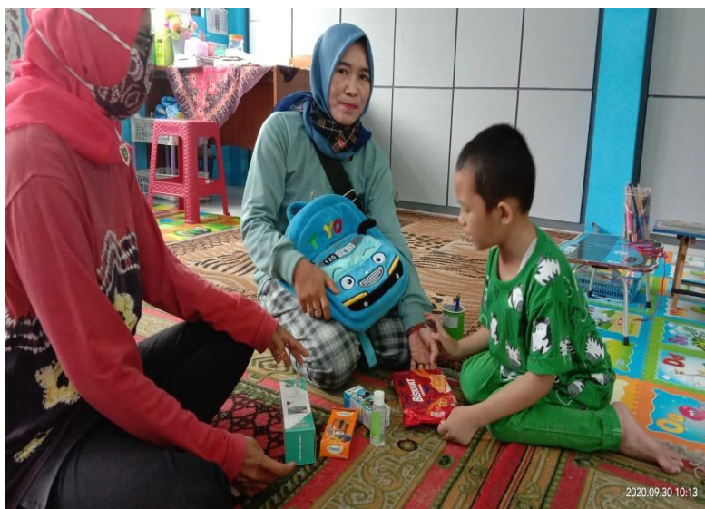
Gambar IV.2 Anak Berkebutuhan Khusus Menerima Vitamin dari Guru

Program kerja yang juga dilaksanakan untuk anak berkebutuhan khusus adalah adanya kunjungan dari psikolog atau dari puskesmas serta kerjasama dengan rumah sakit yaitu RSUD Ulin Banjarmasin terkait dengan anak perkembangan anak berkebutuhan khusus. Program kunjungan ini bertujuan agar orang tua dapat melakukan konsultasi terkait dengan perkembangan anak berkebutuhan khusus. Selain itu dari pihak puskesmas juga memberikan vitamin untuk anak pada umumnya maupun anak berkebutuhan khusus dan orang tua dapat berkonsultasi dengan pihak puskesmas terkait dengan perkembangan anak baik anak pada umumnya maupun pada anak berkebutuhan khusus.