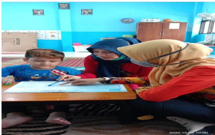
Gambar IV.4 Anak Berkebutuhan Khusus Belajar didampingi oleh guru dan orang tua

Untuk anak-anak berkebutuhan khusus, dikarenakan tidak ada guru pendamping maka orang tua lah yang mendampingi anak selama proses pembelajaran di dalam kelas, tidak hanya orang tua tetapi juga bisa anggota keluarga yang mendampingi anak. Hal ini dimaksudkan agar ketika anak berkebutuhan khusus melakukan sesuatu yang tidak bisa guru kendalikan, maka orang tua dapat membantu guru dalam mendampingi anak. Namun demikian, ketika anak berkebutuhan belajar bersama dengan anak-anak pada umumnya tentu mendapat perhatian yang lebih dari guru kelas.