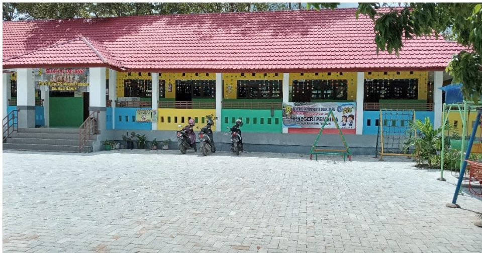
Gambar IV.1 Tampak Depan Halaman TK. Negeri Pembina Banjarmasin Timur

Lokasi penelitian yang diteliti oleh peneliti beralamat di Jl. Lingkar Dalam Utara RT. 5 RW. 01 Kelurahan Benua Anyar Kecamatan Banjarmasin Timur Kota Banjarmasin Provinsi Kalimantan Selatan dengan Kode Pos 70237. TK.