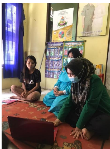
Gambar V. Foto bersama responden