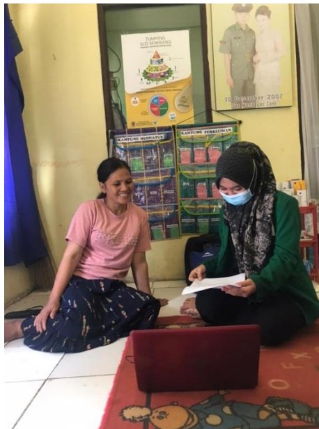
Gambar IV. Foto bersama Responden