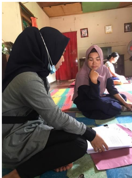
Gambar III. Foto bersama Ibu Kader Posyandu