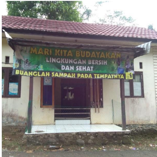
Gambar II. Rumah Dinas Petugas Kesehatan Cabai Patikalain