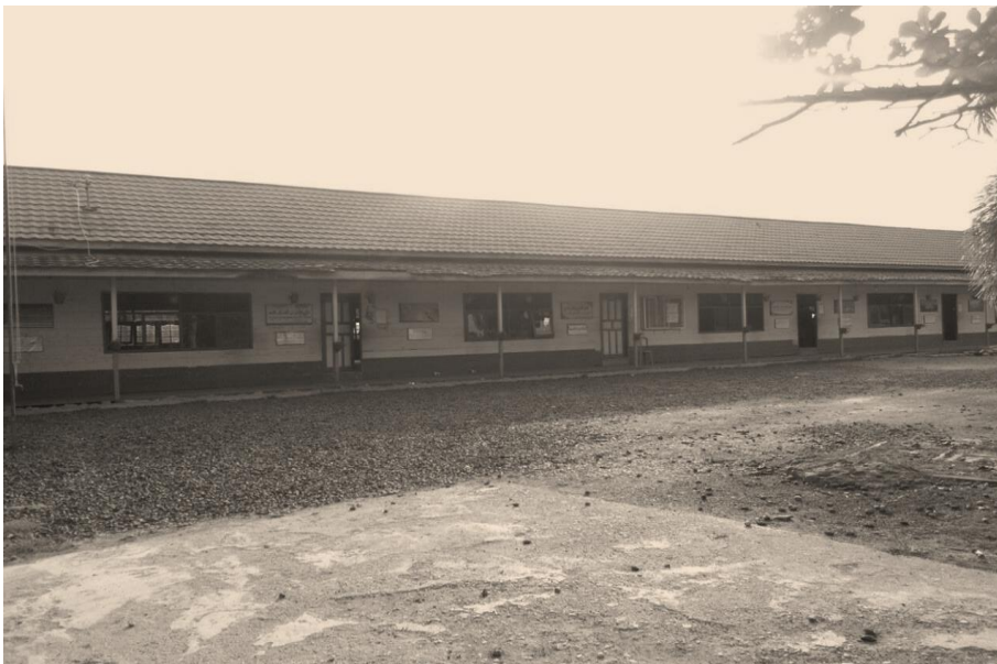
Lokasi Sekolah/Ruang Kelas MA Manba'ul 'Ulum Kertak Hanyar