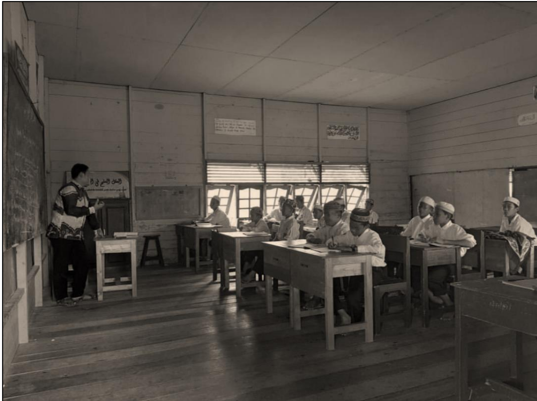
Proses penerapan metode drill pada mata pelajaran Quran Hadits