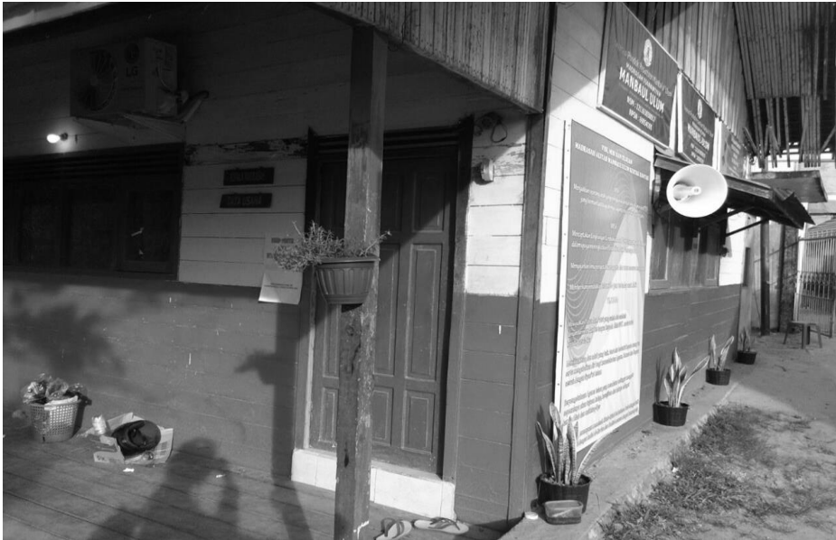
Kantor MA Manba'ul 'Ulum Kertak Hanyar