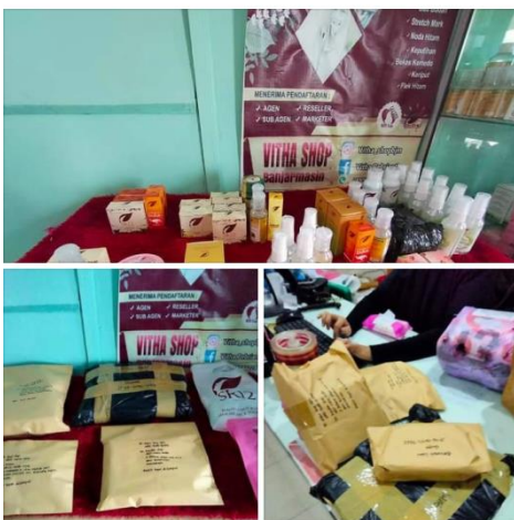
👍 Vitha Pebrianti dan 10 lainnya

Alhamdulillah, orderan melimpah, semoga bsa lebih bnyk lagi dpt orderan, amiin 🙏 Mau punya penghasilan sendiri ? Jualan sr12 aja , repeat order ny tinggi, hrga terjangkau, manfaat nya bnyk 🥰 Produk untuk semua kalangan, aman untuk bumil dan busui.. Chat klo mau tnya2 0895700880224