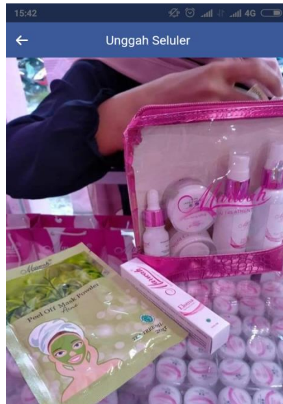
Marwah Skintreatment Banjarmasin MARWAH Terkesan MAHAL Bagi Yg Tanya Doang 🤔 Tapi Terlihat MURAH Bagi Yg Sudah Tau Manfaatnya 😊 Setuju?? 👉👉👉