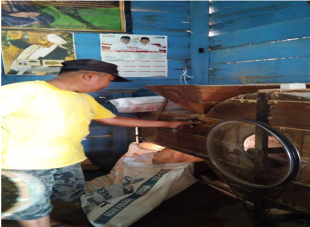
2. Foto gabah padi pelanggan di dalam pabrik