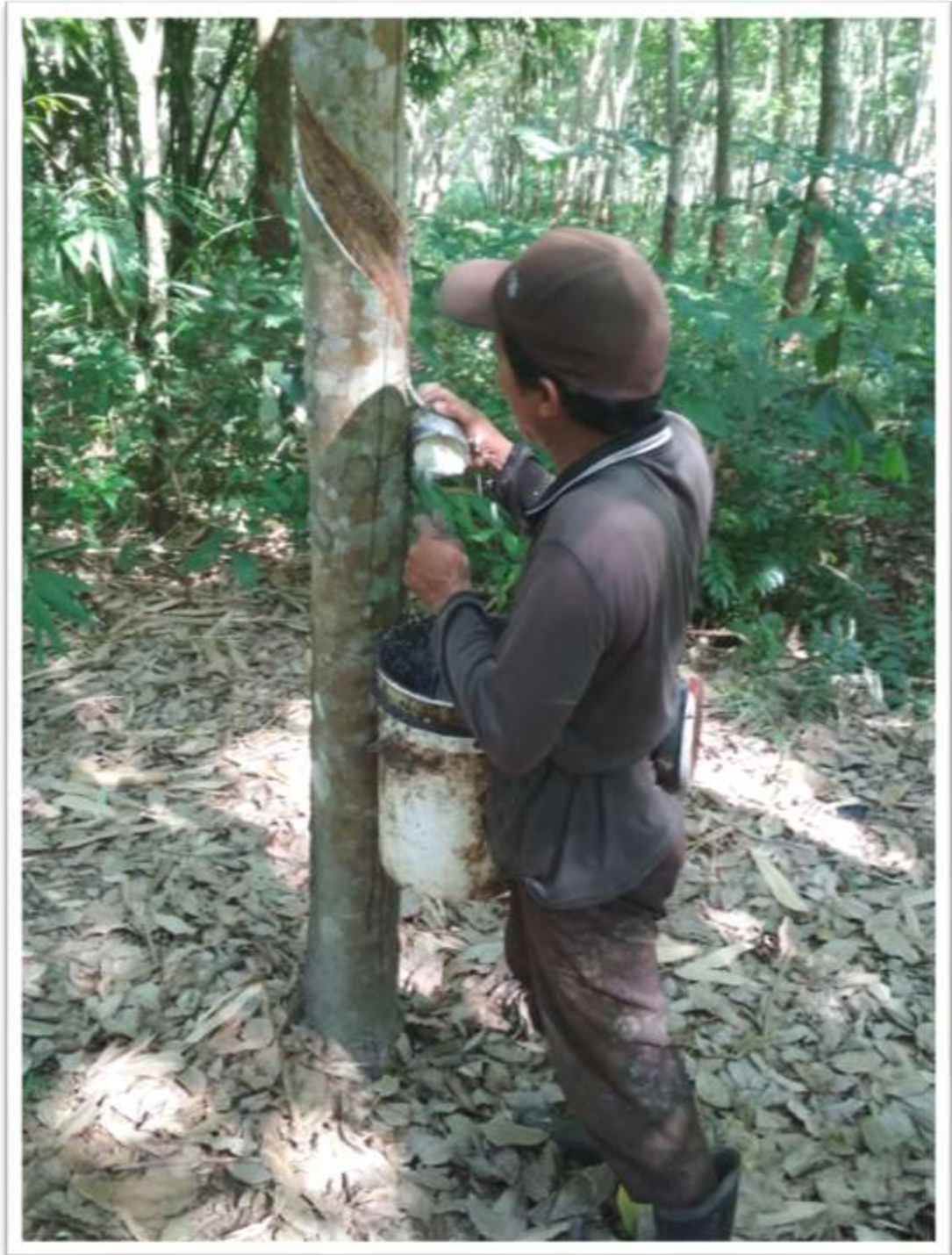
Petani karet sedang menyadap pohon karet