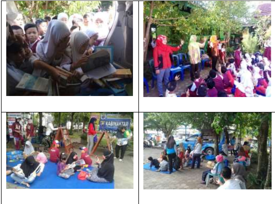
GAMBAR IV Kegiatan Layanan Keliling Sebelum Pandemi Covid-19