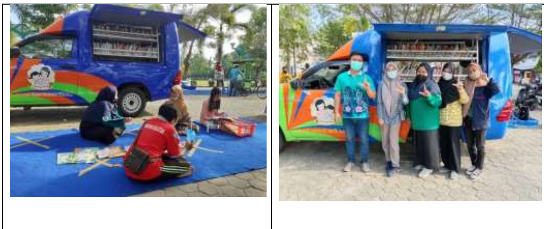
GAMBAR V Kegiatan Layanan Keliling Masa Pandemi Covid-19