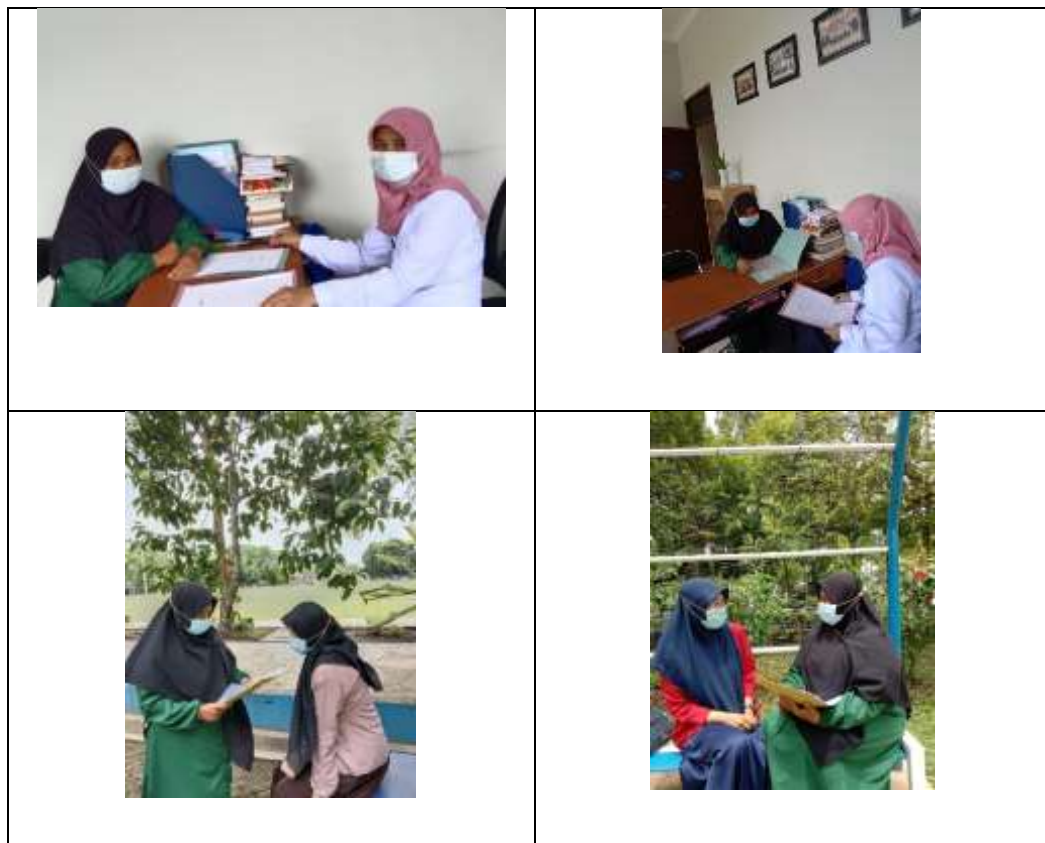
Gambar III Wawancara dengan Informan